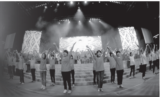
會屬中學百名學生載歌載舞獻唱『佛誕吉祥』