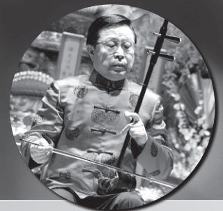
二胡大師王國潼教授