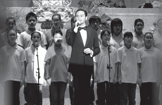
歌星張智霖與會屬小學生齊唱『十方一念』