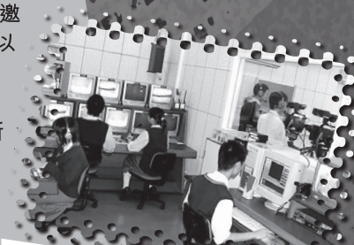
佛教黃允畋中學校園電視台 由學生主導