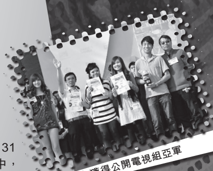
校友獲得公開電視組亞軍

電話：2605 8369 網址： http://www.bwwtc.edu.hk