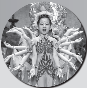
天真瀾漫的小孩子精彩歌舞表演