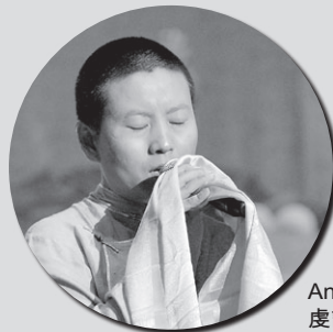
Ani Choying 虔誠莊嚴的歌唱演出