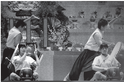
十鼓演出者的激昂英姿