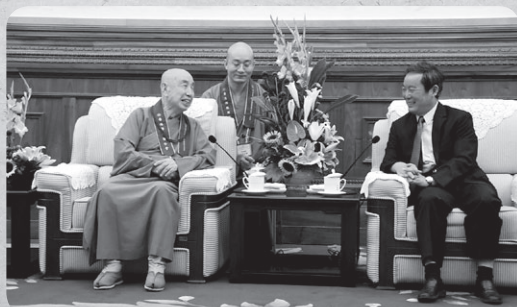
統戰部常務副部長朱維群與覺光長老交談