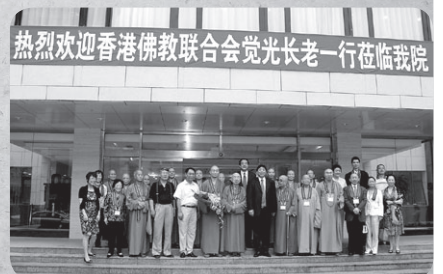
葉小文書記與代表團合照