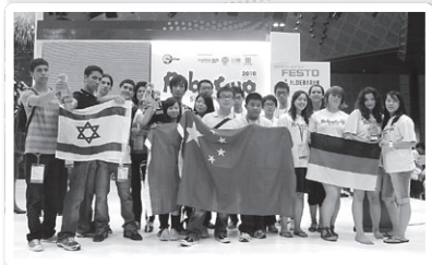
佛教何南金中學同學代表中國，贏得世界冠軍