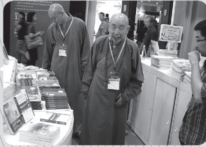
佛聯會會長覺光長老到訪本會攤位