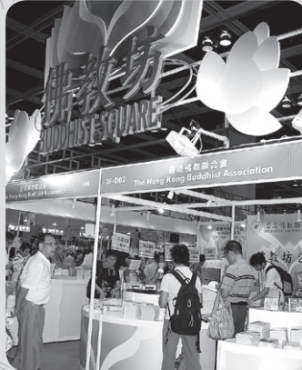
香港佛教聯合會攤位