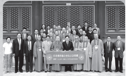
代表團與宗教局王作安局長及各位領導合照