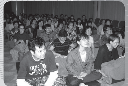
參加講座人士專心聆聽法師開示