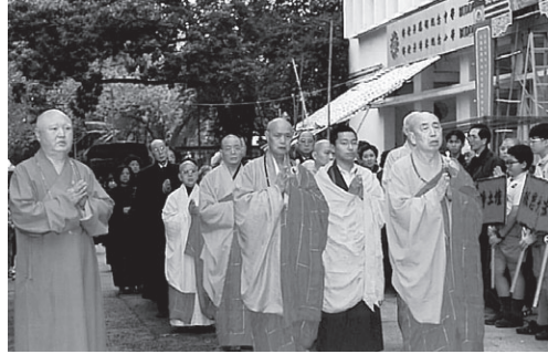
93年清明法會聖一老和尚與覺光長老及眾法師主持送聖儀式