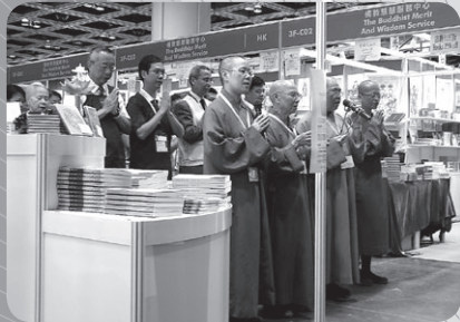
佛教坊開幕儀式—眾位法師帶領全體工作人員虔誦經文