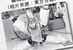
機械古埃及法老王