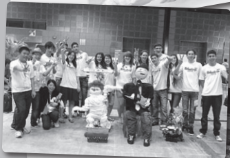
佛教何南金中學同學與以色列及德國隊合照