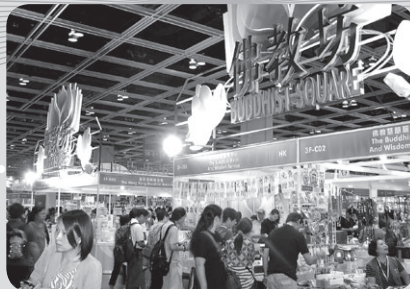
書展參觀人士到訪佛教坊