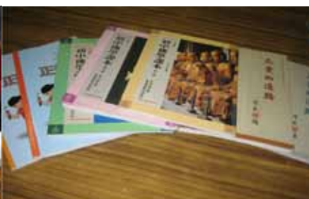
目前會屬佛教中學的初中和高中佛學課本，分別以覺光法師和衍空法師所著的課本為課程指引。