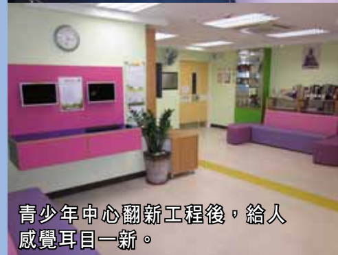
青少年中心翻新工程後，給人感覺耳目一新。