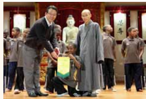
佛教孔仙洲紀念中學舉辦與非洲學生的宗教交流活動，使學生分享其他國家的生活情況。