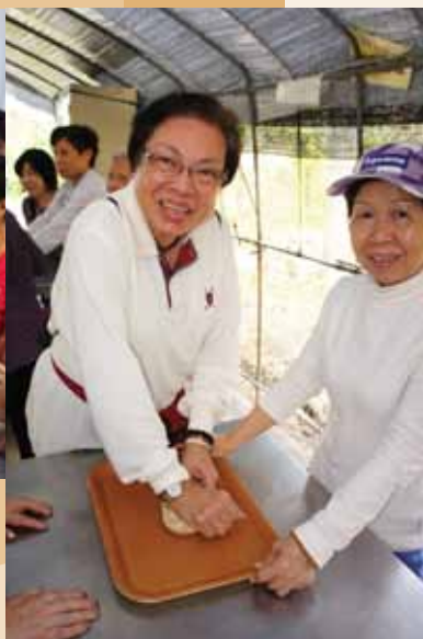
義工們親手做綠田園的有機麵包。