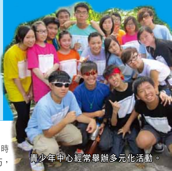
青少年中心經常舉辦多元化活動。

該中心負責人曾 Sir 指出，由於現時唱卡拉 OK 或夾 Band 的設備、時間限制和場地費用十分昂貴，令有興趣夾 BAND 或初學的青人卻步，所以針對青少年這方面的需要，「Band 仔房」可以讓他們享有自主及發展空間，盡情地發揮所長，確立自我形象，提升自信。