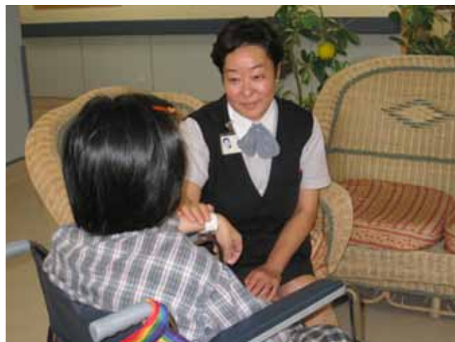
「安養服務」 的心靈生活。 醫療團隊關顧病者