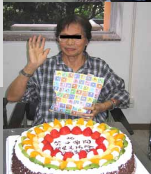
「安養服務」協助病者開心地面對人生，豐富晚期最後的生活。