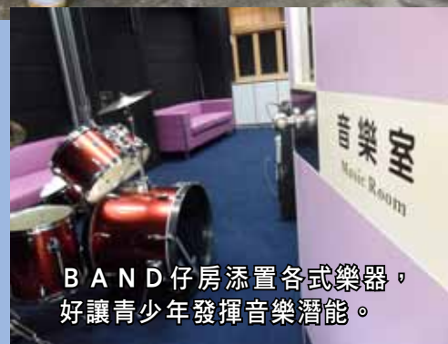
BAND 仔房添置各式樂器，好讓青少年發揮音樂潛能。

夾 BAND 主要是聚集一班志同道合的青年朋友一起玩音樂，沒有特定的路線，主要是看年青人的喜好而定，換句話說，例如他們喜愛 HIP HOP 音樂，便向 HIP HOP 發展，隨年青人的喜好。若能配合 BAND 仔的期望，亦有機會作出佛教歌曲的嘗試。