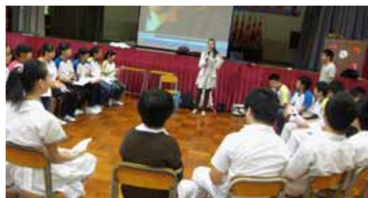
佛教覺光法師中學進行清晨定期聚會「與生命相約」，以禪修和音樂鼓勵學生持之以恆地學習佛法。

無可否認，當世學生承受的壓力與日俱增，主要來自學業、家庭、人際關係、人生得失和社會方面。佛學科老師試圖以佛學的理念，讓學生的心靈得到淨化，將內心的壓力釋放，如透過禪坐靜修反思生命、強調不努力讀書必致成績未如理想的自作自受等因果關係，以及佛學對人生成敗得失的演繹，為學生提供一個增強自信心、提昇心靈的空間。