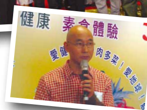
▲盧冠廷主持講座講解世界環保問題