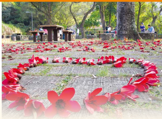
陶淵明《歸去來辭》有云：農人告余以春及——可說明一眾年青人在火紅木棉樹下坐禪的感覺。

佛教是世界三大宗教之一，傳統中國文化受儒釋道影響最深。但在現今的香港，仍有不少人覺得佛教是老人家與婦孺的迷信，想來也覺得可惜。在參與弘法使者的工作中，我不時會留意一些能吸引青少年的活動，想想我們可以辦佛法義工團嗎？可以和其他非牟利機構合作，借鑒他們辦活動的經驗嗎？我一個人力量有限，但隨著每年各佛教中小學相繼有不少學生畢業，而弘法使者也走進