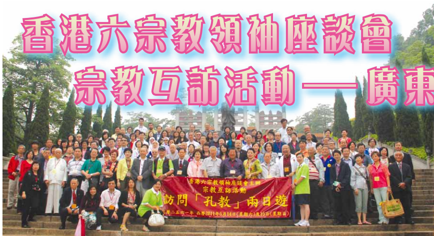
▲參加者於孔聖園內合照

宗教和諧是地區和平的重要基礎，香港的佛教、天主教、孔教、伊斯蘭教、基督教及道教被稱為香港六大宗教，早在三十三年前，六宗教便組成香港六宗教領袖座談會，每年定期舉行座談會、思想交談會和各類活動，增進宗教間的相互溝通，促進社會和諧。