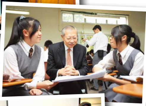
▶ 孫局長細意欣賞學生創作無伴奏音樂