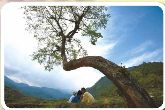
◀今年「心觀自在」攝影講座 的嘉賓黃河清博士的作品

此外，香港佛慈淨寺將舉辦吉祥抄經法會，恭敬虔誠抄《八大人覺經》，迴向世界吉祥，消災解難。法鼓山文教基金會(香港分會)主辦生活禪講座，以實用、易學的禪修觀念與方法，幫助我們在緊張的日常生活中，體驗如何放鬆身心，令心不隨境轉。而佛教青年協會亦會舉行佛學講座，講解佛學知識。■