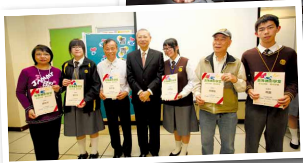
◀ 孫局長頒發耆青攝影學堂畢業證書並與一眾畢業生合照