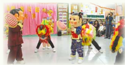
▲教師大合照 ▲醒獅表演