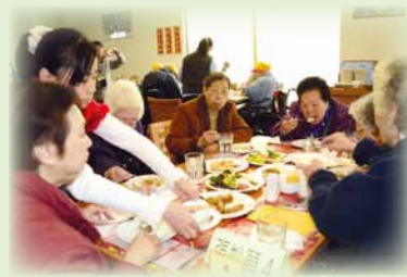
◀同學義工招呼家長用膳