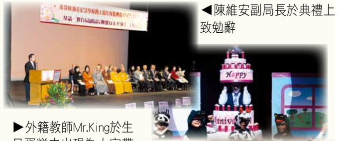
◀陳維安副局長於典禮上致勉辭

佛教林炳炎紀念學校於2011年12月17日假座葵青劇院舉行四十週年校慶典禮，邀得教育局副局長陳維安太平紳士主禮、學校捐建人林炳炎居士家族成員蒞臨。典禮活動包括一連串精彩的表演，像中國舞蹈、武術、十鼓和兩文三語話劇，典禮在一片歡笑聲中結束。欣逢創校四十週年，林炳炎居士家族更捐款五十萬元為全校教室安裝電子白板及購置平板電腦，供學生學習之用，以進一步提升學與教效能，造福一眾學子。☉