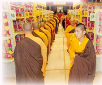
▲藉著清明法會迴向堂佛法僧三寶的加持和誦經，為孝子賢孫提供一個追悼先人、延生祈福的機會。