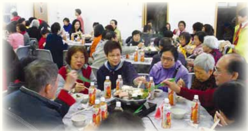
▲ 天氣寒冷，最好就是聚首一齊吃素盆菜。