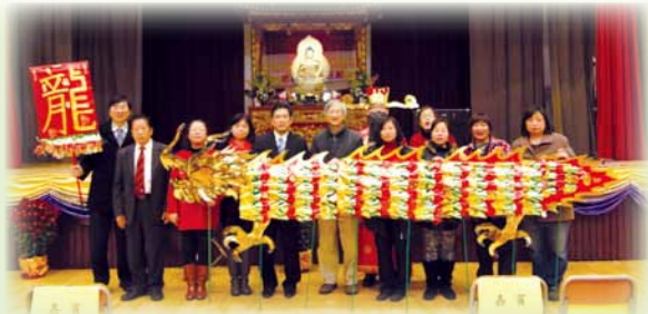
▲家長自製金龍賀歲 ▶財神大派利是

大家一邊享受豐盛的晚餐，一邊欣賞有趣的餘慶節目，歡樂之聲散滿每個角落，讓學生、家長及教師一同在學校這個大家庭裏度過熱鬧繽紛的新春佳節。