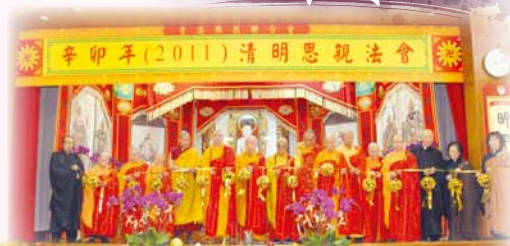
▲香港佛教聯合會每年於清明節期間舉辦「清明思親法會」，服務市民至今五十多年。

香港佛教聯合會每年於清明節期間舉辦「清明思親法會」，服務市民至今五十多年，給予孝子賢孫為先親眷屬薦薦超度，為在世親友祈福積德、聊表孝義的機會，亦為社會善信提供