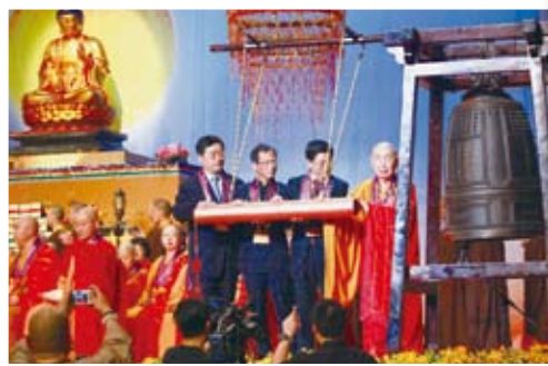
▲會長陪同三位主禮嘉賓主持鳴吉祥鐘儀典