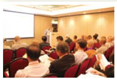
◀ 第三屆世界佛教論壇分組論壇情況