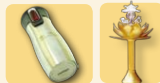
特製保暖杯(專利設計單手開關，不含雙酚A) 吉祥燈