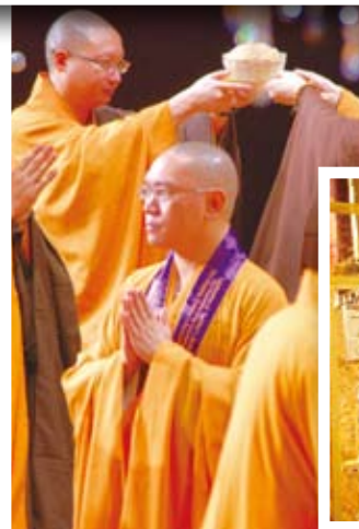
▶法師恭敬傳送供品到佛前