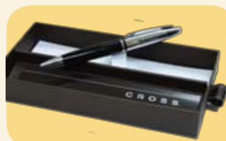
尊貴名筆一枝(價值$250)