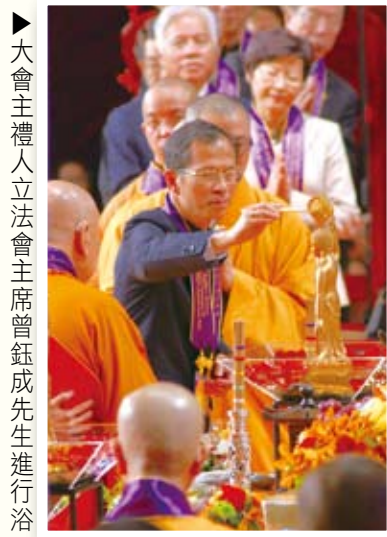
▶大會主禮人立法會主席曾鈺成先生進行浴佛儀典