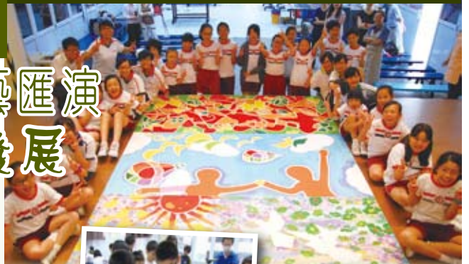
佛教何南金中學的多元活動有助學生發展潛能