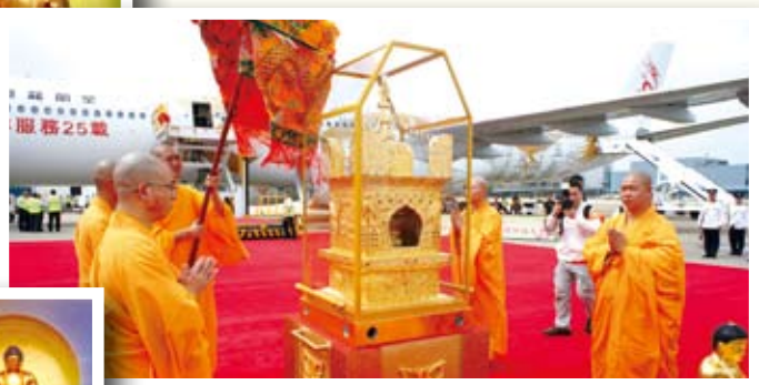
◀ 澳門機場恭迎舍利抵達

署陳甘美華署長與中國佛教協會副會長學誠大和尚致辭；最後，在覺光長老致圓滿辭後，為期六天的瞻禮祈福大會宣佈圓滿成功。舍利隨即移離禮台，過百位居士虔誠下跪散花，恭送舍利離開場館出發前往機場。