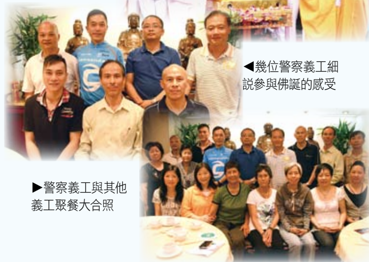
▶警察義工與其他義工聚餐大合照