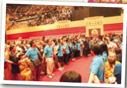
◀教師協助人流控制