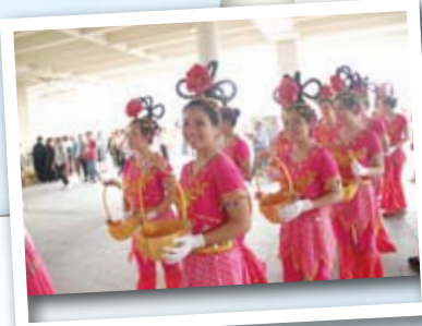
▲學生「仙女」向舍利散花

在我們表演前後，大會工作人員都對我們照顧周全。他們真誠的態度，使我們深受感動。本樂團衷心多謝香港佛教聯合會一直以來對我們的欣賞和支持，希望日後本團有更多機會為各佛教慶典及慈善活動出一分力，我們承諾會努力表演，做到最好。