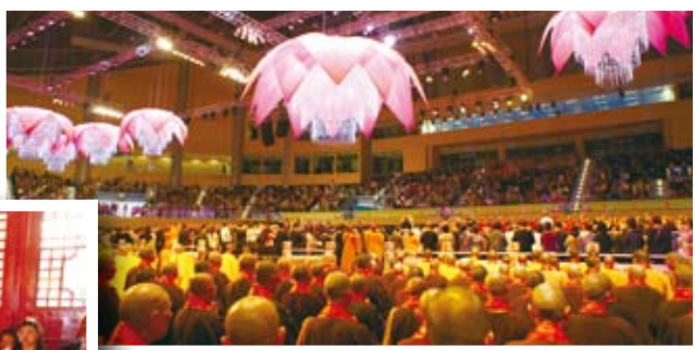
◀ 佛頂骨舍利返回到棲霞寺安奉好後諸位大和尚向佛舍利頂禮