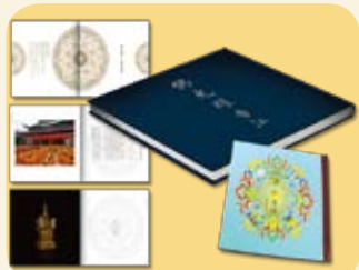
《佛光耀香江》佛頂骨舍利紀念冊 連珍貴紀錄DVD (價值$180)