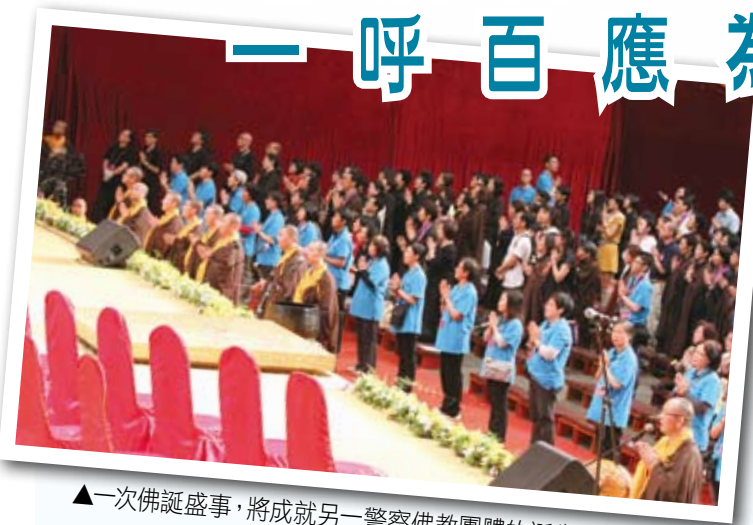
▲一次佛誕盛事，將成就另一警察佛教團體的誕生。