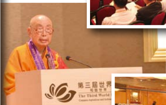
▲ 覺光長老宣佈論壇圓滿閉幕