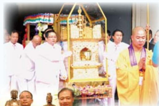
◀幾位警察義工細說參與佛誕的感受