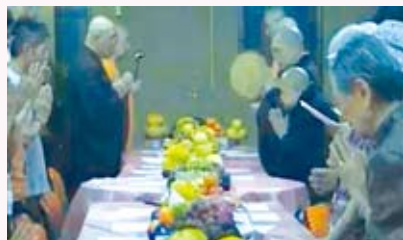
◀香港部分道場每年都會舉行中秋普茶活動，圖為香港觀宗寺的中秋普茶情況。

較為莊嚴而輕鬆。普茶一般安排在晚上7點開始，當大眾聽到鐘聲後，隨即穿衣搭袍，三三兩兩的來到齋堂，恭候方丈大駕。齋堂佈置方面，僧人會在監齋菩薩前，點燃兩根大蠟燭，而齋堂的條桌上，則放滿了水果、花生、瓜子、糖果等應節果品，每位僧人面前還會放著一個茶杯。方丈來到齋堂後，先唱爐香讚，再拈香、禮佛、升座，便坐下來開始給大家開示。這時巡堂會拿著茶壺，依次給大眾倒茶。在柔和的燭光下，在嫋嫋的香煙裏，在方丈和藹的話音中，大家靜靜地品茶、聽道。氣氛熱鬧中帶著祥和、溫煦。