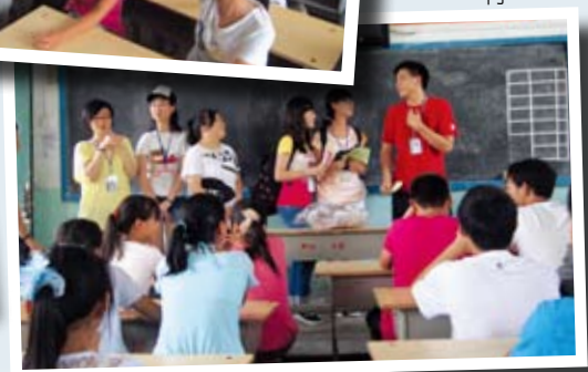
團員在七天的活動中體驗了山區教育及當地農民的生活