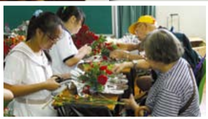
▲學生與長者們一同合力製作一盆花卉，長者們還可把製成品帶走。