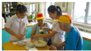
▲學生教導長者們製作蛋糕