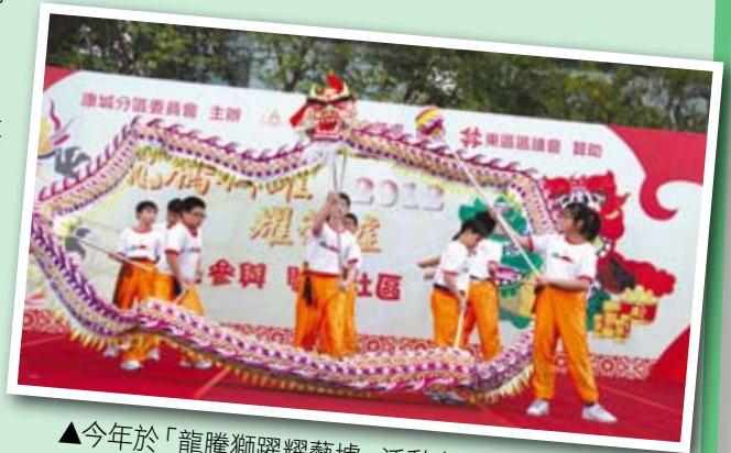
▲今年於「龍騰獅躍耀藝墟」活動中表演