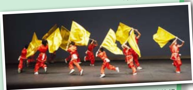
▲四十週年校慶中表演旗操。