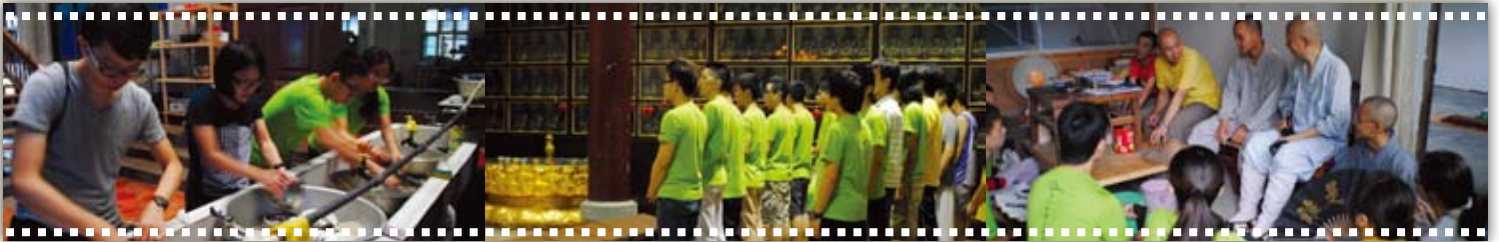
▲同學動手清洗碗筷，體驗「出坡」的感受。

「弘法使者要在夏令營前準備好保險、行程及交通等事項，增長了我們在這方面的知識。期間在營內發生的突發事件，也考驗了我們的應變能力，對日後處事很有幫助。」