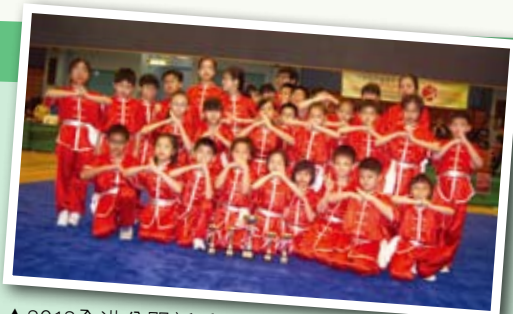
▲2012全港公開新秀武術錦標賽大合照。

武術隊亦取得突出的成績，於本年度全港公開新秀武術錦標賽小學組集體五步拳及外展教練計劃武術比賽小學組青少年章別之第一、二級動作組中皆勇奪冠軍。除此之外，武術隊去年更榮獲教育局邀請參與香港學界慶祝國慶文藝匯演及於佛聯會會屬小學及幼稚園聯合畢業典禮中表演。校方期望武術隊不單為該校訓練出術德兼修的學生，也能培育同學對中華文化的承傳。