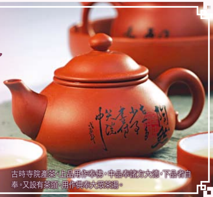
古時寺院產茶，上品用作奉佛，中品奉諸方大德，下品者自奉。又設有茶頭，用作供奉大眾茶湯。

中秋佳節，良朋共聚，以香茶一泡佐月餅瓜果，實在是賞心樂事。佛門亦會在中秋節當天，在寺院內薈集眾僧茗茶，共聚聞道、相互切磋佛法，稱之為中秋普茶。