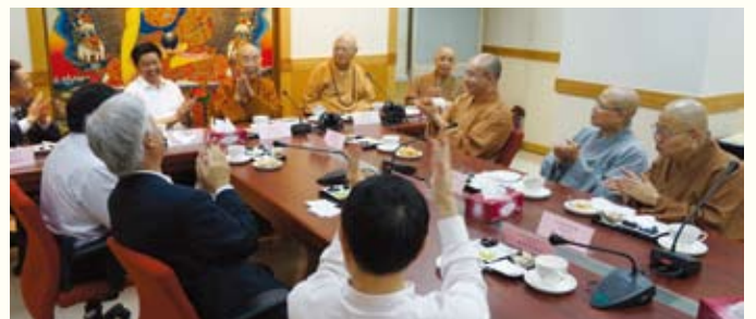
▲會面氣氛親切歡樂