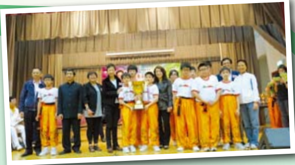
▲龍隊同學在第四屆東區龍獅大賽奪得冠軍獎及「金盃大獎」。

舞龍隊發展至今，曾獲邀到各活動中表演，如「壬辰年港島總區交通安全城開放日開幕禮」、「樂聚康城展才華藝墟2012」及幼稚園校慶日等，均獲一致好評；並於多項公開比賽中奪冠，如第四屆東區龍獅大賽冠軍獎及金盃大獎。令隊員信心大增，表現一日千里。