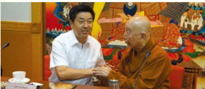
▲國家宗教局副局長張樂斌特別到訪本會並向會長覺光長老問好

張副局長則指出，香港佛教的健康發展，對傳承中國文化十分重要，因為中國在市場經濟發展下，只是依靠法治並不足夠，唯有宗教才能讓人自覺向善。最後他祝願各長老德大德身體健康，為推動佛教事業再作貢獻。☉