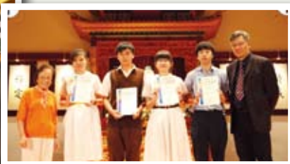
▲學生義工們接受嘉許狀