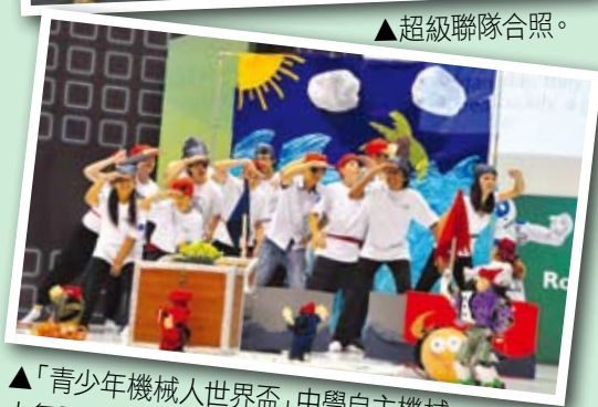
▲「青少年機械人世界盃」中學自主機械人舞蹈組超級聯隊比賽。