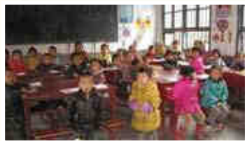
▲丹寨大雄希望小學加設了學前班。

七天的行程，探訪團走訪了從江、丹寨、劍河、黃平和貴定五個縣，視察了十一間學校，見了五千多位學生，學校中有成為中心小學的，有加建了學生宿舍或食堂的，學生營養午餐也有補助。看到學生生活得以改善，相信捐校和支持希望工程的善長均會感到欣慰。在此，再次感謝多年來捐助「希望工程專戶」的善長，您們的捐款為遠方的孩子們帶來了希望和溫暖。☸