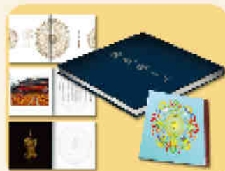
《佛光耀香江》佛頂骨舍利紀念冊 連珍貴紀錄DVD (價值$180)+佛誕吉祥CD