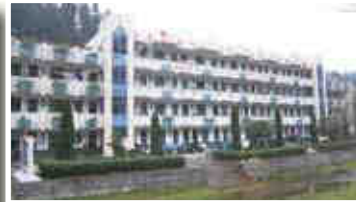
▲馮鑑堅紀念希望中學是本會援建學校中最具規模的一間。