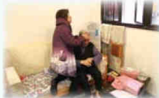
黃女士為余婆婆按摩後腦。