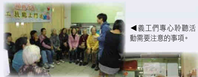
◀義工們專心聆聽活動需要注意的事項。