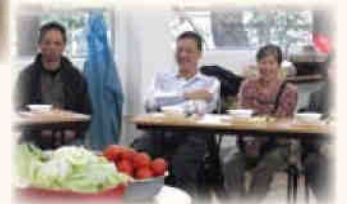
▶大家在愉快的歡笑聲中享受禪趣。