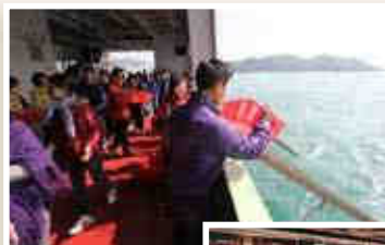
◀善信懷慈悲心放生添功德。