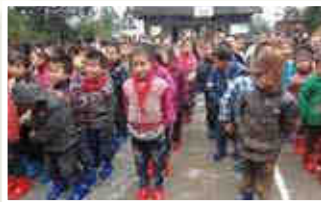
▲一雙保暖水靴，為孩子們帶來溫暖。