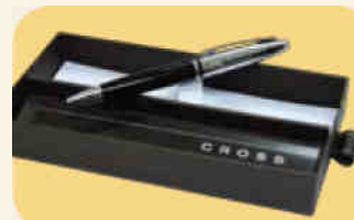
尊貴名筆一枝 (價值$250)