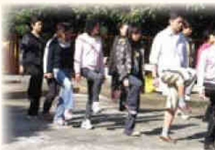
◀天氣十分好，齊來動禪吧！

做過動禪練習，放鬆心情後，便開始學習行禪。參加者依著一步一呼吸的節奏，圍繞著中心步行，感受大自然的寧靜。當所有參加者都「靜」下來了，導師開始教授大家「打坐」。法師建議學子每天要進行10—15分鐘的禪坐，並要持之以恆。