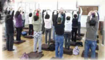
▶參加者都一同練習八式動禪，舒展筋骨。