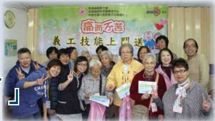
▲佛教張妙願長者鄰舍中心職工與義工大合照。