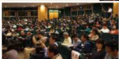
◀市民踴躍參與思想交談會