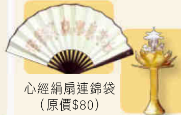
心經絹扇連錦袋 (原價$80)