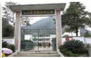
▲釋大光紀念希望學校今天已成為光輝鄉中心校。