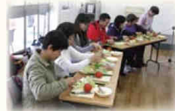
◀大家都專注製作禪食。

活動結束前，參加者分享了對禪修的感受。參加者從禪修的過程中，鬆弛身心，學習以安然休閒的步調面對日常生活的焦慮不安與憂懼，並把一切憂愁都輕鬆自然的「放下」！☸