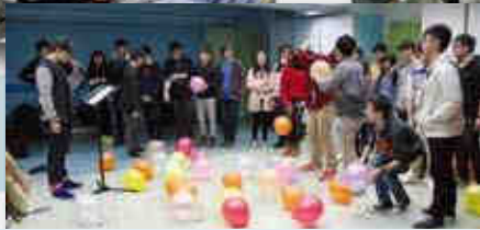
◀嘉賓樂團落力表演,觀眾一邊欣賞,一邊玩氣球,氣氛融洽。

燈光漸漸減弱,一樣年青人戴上樂器,踏上表演舞台,無須語言,透過音符,彼此之間已經心照不宣。