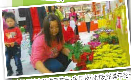
▲佛教傳康幼稚園花市，家長及小朋友採購年花。