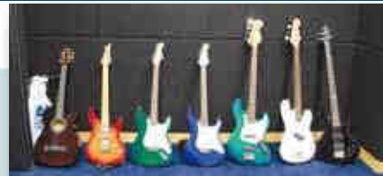
◀BAND仔會內精巧的結他。