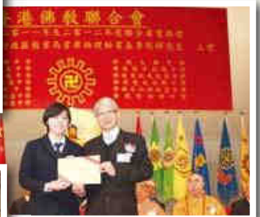
▲教育局首席助理秘書長李煜輝先生頒發畢業證書。