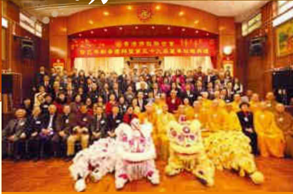
董事、嘉賓與醒獅一起開心大合照。