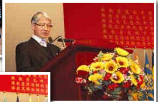
▲教育局首席助理秘書長李煜輝先生致訓辭。