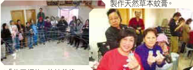
▲「義工網絡」共結善緣。