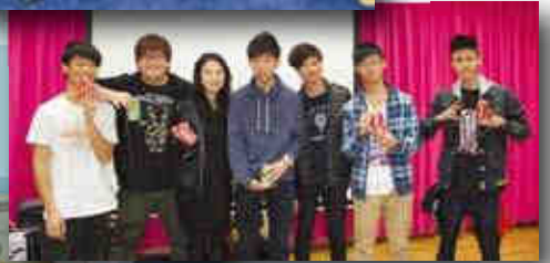
◀肥wing母親(左三)與90's成員非常熟稔。