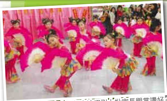
▲中國舞表演吸引大批家長觀賞讚好。

該校推行是次活動的目的除了迎接新的一年，最重要是透過活動來推動環保的意識。活動前幼兒在日常生活中搜集不同的環保物料，循環再用，在師生的合作下創作出九龍吐珠、雙魚報喜、桃花迎春等吊飾，張掛在校內作為佈置用途。還有當天邀請到專業的環保公司親臨推介有機、有營的素食食材製作賀年食品，讓我們在新春期間吃得更健康、更有益，此活動既歡樂，又有教育意義，何樂而不為呢？學校希望讓幼兒感受新年的節日氣氛和習俗，與家人共聚天倫，從而帶出親子和諧共聚及歡樂的信息。☺