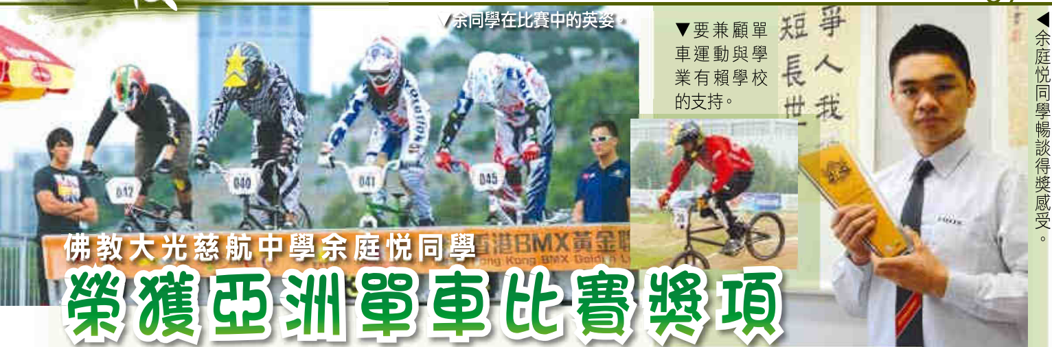
▼余同學在比賽中的英姿