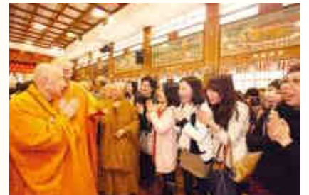
▲賓客熱烈向會長拜年。