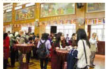
▲賓客在儀式過後歡聚並享用茶點。