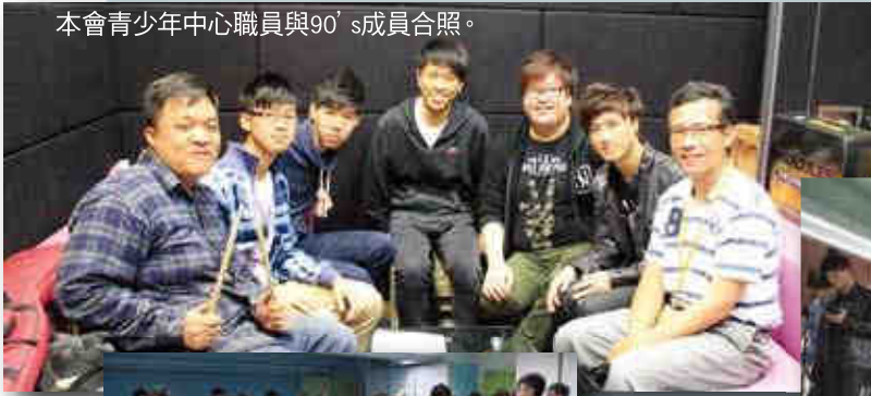
本會青少年中心職員與90's成員合照。