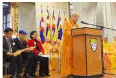
◀覺光長老致祝福辭。