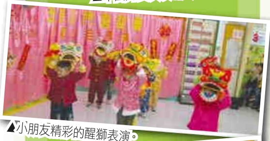
▲小朋友精彩的醒獅表演。