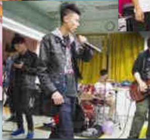
▶嘉賓樂隊應邀演出,互相交流。