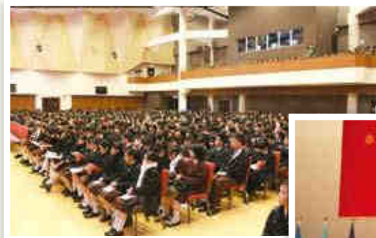
▲超過一千名學生出席，場面莊嚴。