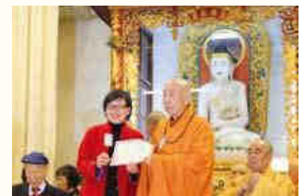
▲覺光長老接受民政事務局許曉暉副局長頒授證書。