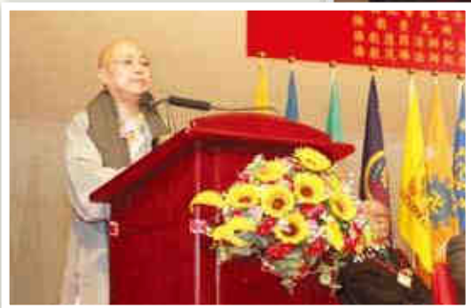
▲學務管理委員會副主席演慈法師匯報校務。