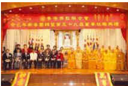
◀本會第59屆董事與民政事務局許曉暉副局長在台上大合照。