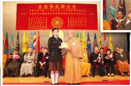
▲副會長智慧大和尚頒發獎學金。