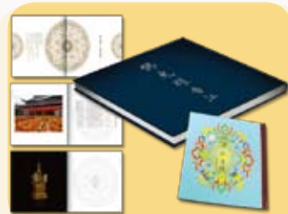
《佛光耀香江》佛頂骨舍利紀念冊 連珍貴紀錄DVD (價值$180)+佛誕吉祥CD

香港佛教聯合會將盡力遵守《個人資料(私隱)條例》中所列載的規定，確保儲存的個人資料準確無誤，及有妥善的儲存方法。您提供之個人資料，將用作訂閱《香港佛教》之用。但香港佛教聯合會可能使用您的個人資料(包括您的姓名、電話、傳真、電郵及郵寄地址)，以作日後與您通訊、籌款、介紹活動/法物、邀請或收集意見的推廣用途，您亦可以隨時要求本會停止使用您的個人資料作上述推廣之用途，費用全免。日後查閱或更新資料，請隨時致電2574 9371。