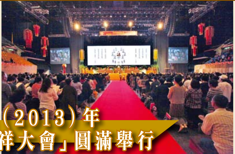
◀萬人皈依,信眾正式成為佛弟子,日後遵循佛陀教誨,行善積德。

三天的佛誕節吉祥大會以莊嚴的傳吉祥燈法會結束,法會由覺光長老、智慧長老聯同多位長老德共同帶領,導引佛陀智慧之光,燈燈相傳信眾,以喻眾生秉承佛陀教誨為善,破除黑暗。☸