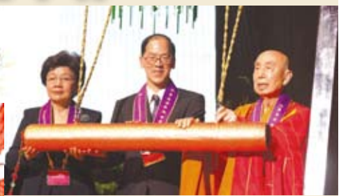
◀覺光長老在致辭時表示,我們藉由浴佛洗滌身心,首先要學會尊重與包容,培養慈悲和感恩之心。