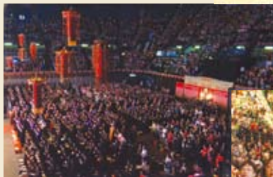
▶十方信眾雙手合十,虔誠念誦經文,懺悔身心。