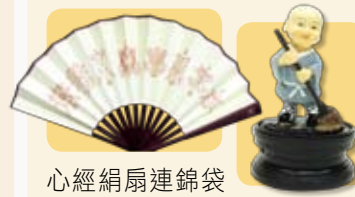
心經絹扇連錦袋 (原價$80) 精美小沙彌