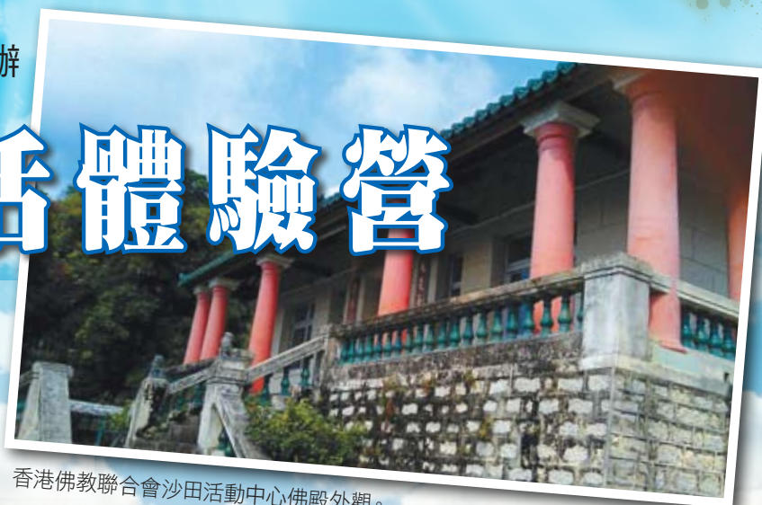
香港佛教聯合會沙田活動中心佛殿外觀。

「佛化生活體驗營」系列活動以聽經聞法、禮佛拜懺、參禪悟道為主軸，幫助信眾種下菩提種子，踏上快樂之學佛路！