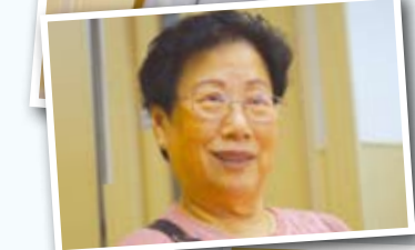
▲楊太分享中心的中醫服務對自己的幫助。