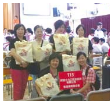
▶娟姐(後排右二)與其餘五名本會的義工抱著裝有西莓乾、提子乾、愛心米、襪子等物品的愛心百福袋，準備送給有需要的長者。