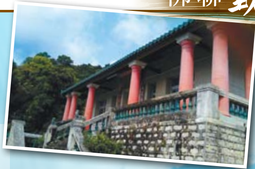
香港佛教聯合會沙田活動中心佛殿外觀。

「佛化生活體驗營」系列活動以聽經聞法、禮佛拜懺、參禪悟道為主軸，幫助信眾種下菩提種子，踏上快樂之學佛路！