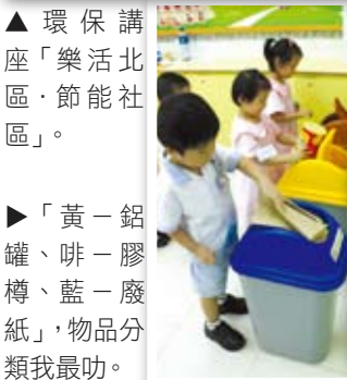
▶「黃—鋁罐、啡—膠樽、藍—廢紙」，物品分類我最叻。