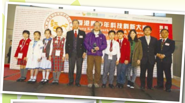
▲第廿八屆香港青少年創新科技大賽——優秀組織學校

學校或學生於各項環保科技教育活動或比賽中獲得優秀成績，自2010/2011學年起，學校四度獲得由環境保護運動委員會頒發「香港綠色學校獎」及三度獲「香港環保卓越計劃-界別卓越獎（銀獎）」。學生們於「第廿八屆香港青少年創新科技大賽」分別獲得小學研究論文組二等獎、科學幻想畫組二等獎及優異獎，學校則獲得優秀組織學校獎，並獲賽會推薦參加「第28屆全國青少年科技創新大賽」之「十佳科技教育創新學校」、「基層賽事優秀組織單位」及「科技輔導員創新項目」三個組別，比賽將於2013年8月舉行，有望能再接再厲，再創佳績。