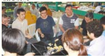
▲透過燒烤素食，讓學員彼此認識，增進感情。