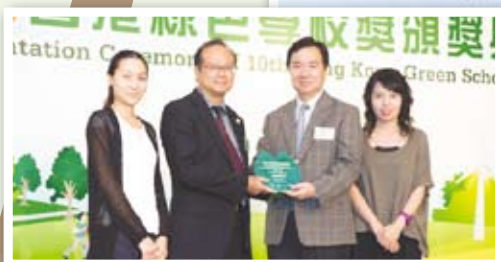
▲第十屆香港綠色學校獎