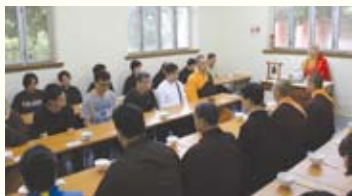
▲午齋禁語，讓學員學習專注重用，感受食物的真味。