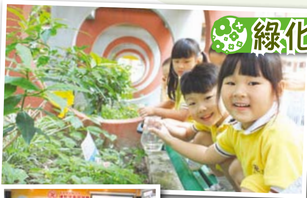
▲綠色生活由我做起。

本年度學校積極參與社區綠化活動，教師與幼兒體驗種植及綠色生活的益處。參與舊衣回收捐贈活動，將舊衣送贈有需要的人。邀請北區環保組織親臨校園以「樂活北區·節能社區」講座，宣揚節能的方法。藉著學校與社區攜手合作，將環保節能的訊息傳遞給家長及幼兒，以達致「綠化節能齊齊做」的目的。☉