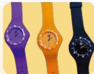
六字大明咒膠帶手錶 (價值$280)

香港佛教聯合會將盡力遵守《個人資料(私隱)條例》中所列載的規定，確保儲存的個人資料準確無誤，及有妥善的儲存方法。您提供之個人資料，將用作訂閱《香港佛教》之用。但香港佛教聯合會可能使用您的個人資料(包括您的姓名、電話、傳真、電郵及郵寄地址)，以作日後與您通訊、籌款、介紹活動/法物、邀請或收集意見的推廣用途，您亦可以隨時要求本會停止使用您的個人資料作上述推廣之用途，費用全免。日後查閱或更新資料，請隨時致電2574 9371。