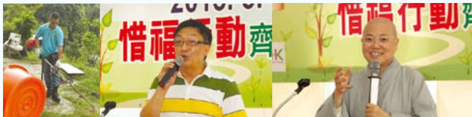
▲除了耕作之外，義工們還幫忙除草！