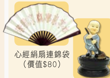
心經絹扇連錦袋 (價值$80)