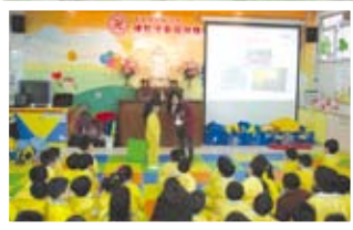
▲環保講座「樂活北區·節能社區」。