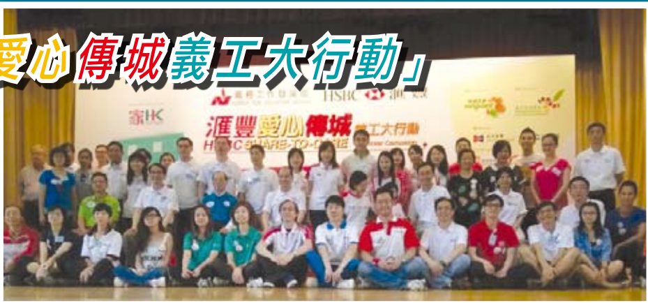
▲義工雲集，勞工及福利局局長張建宗亦親臨支持這次充滿愛心的義工活動。

娟姐希望可以繼續秉承佛陀精神，走入社區，服務更多有需要的人士，看到他們歡樂的笑容，就覺得整個人都充滿正能量。☸