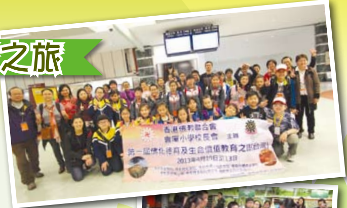
▲會屬7間小學佛化德育及生命價值教育之旅出發！

行程的最後一天探訪了佛光山普門寺，獲住持永富法師親自向各人開示，解答同學們的提問及困擾。使得同學們在旅程中，不單認識保護地球、保護環境，更可透過心靈環保學習佛陀的道理，令眾人獲益良多。