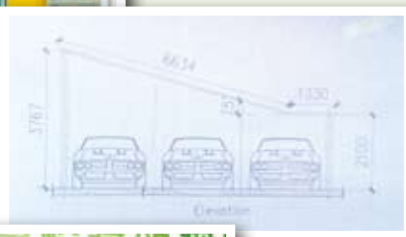
▲太陽能供電系統（進行中）