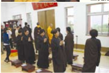
▲學員合什雙手繞佛，虔誠誦經。