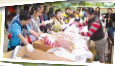
▲大家齊來把垃圾分類循環再造，珍惜資源又環保，地球有救了！