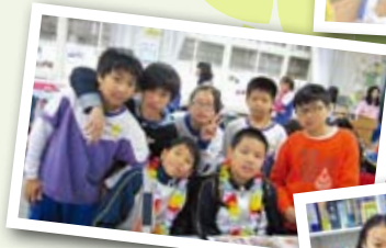
▲台灣、香港小朋友一齊來享受讀報樂。