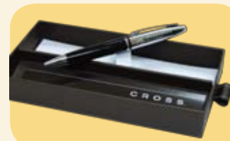
尊貴名筆一枝 (價值$250)