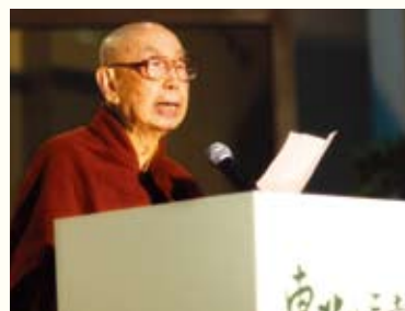
◀本會會長覺光長老在會上致辭懷緬三老。