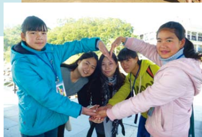
◀感謝為粵北山區獻上愛心的香港朋友們。