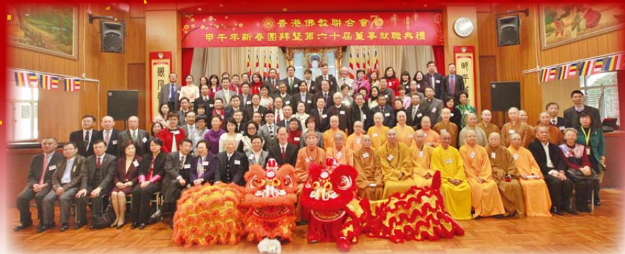
▲新一屆董事、名譽顧問、法律顧問與眾嘉賓大合照。

每年農曆正月初八，本會均會舉行新春團拜和董事就職典禮，好讓各位董事、貴賓、會友、員工一同共慶新春，互相問好。今年2月7日仍繼續在銅鑼灣香港佛教聯合會文化中心舉行團賀及董事就職典禮，共迎新春馬年，並向各界送上祝福！