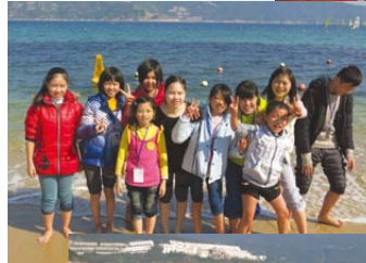
◀▶第一次接觸大海的山區小朋友，對帶有鹹味的海水，顯得既好奇，又興奮，玩得亦樂乎！