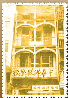
▲1945年開辦中華佛教義學。