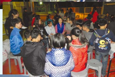
▶香港青年義工與山區小朋友的燒烤晚會，大夥兒有傾有講，場面溫馨。