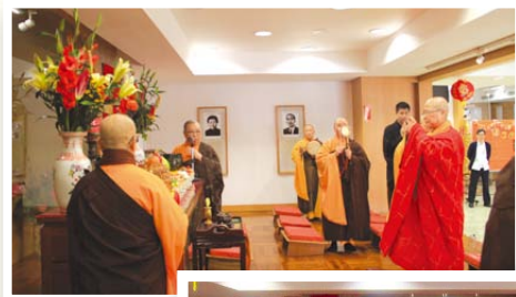
◀本會秘書長演慈法師主持上供儀式。