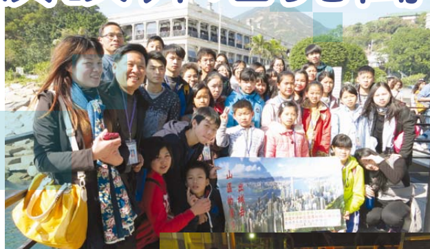
▲到赤柱遊覽，不忘來張大合照。

展望日後，青少年中心將會繼續舉辦同類活動，讓中港兩地年青人有更多交流，互相學習。☺