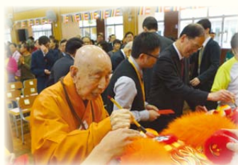
▼會場內嘉賓交談問好。