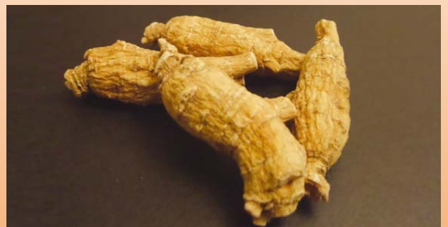
▲花旗參只適用於「虛而有火」的患者，不宜實熱證患者。