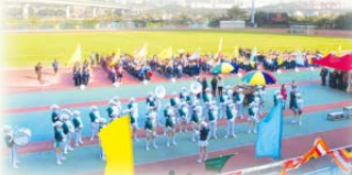
▲佛教沈香林中學派出步操樂團演奏。