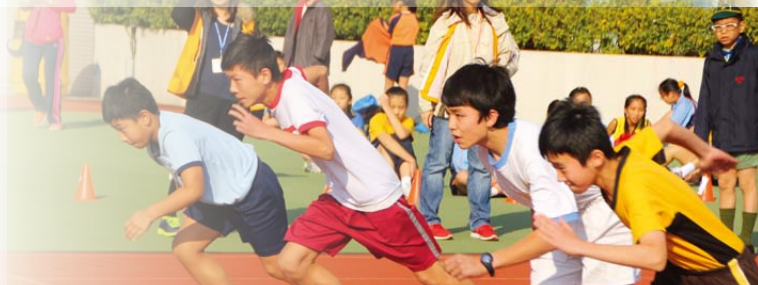
▲佛運健兒全力以赴冀奪金。

1月24日，香港佛教聯合會主辦了「全港佛教小學二零一三至二零一四年度聯合運動大會」(下稱佛運會)。2014年伊始，全港各區共13所佛教小學，齊集於青衣運動場內，透過公平競賽，爭奪包括：跳高、跳遠、壘球、鉛球、60米、100米、200米、4x100米接力賽等大大小小不同項目的獎項。