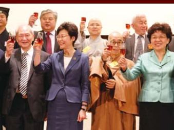
▲主禮嘉賓及主席團祝茶慶賀。