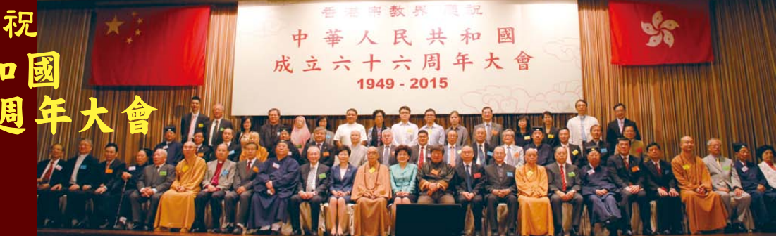
▲主禮嘉賓及主席團大合照

香港宗教界人士於9月22日假龍堡國際賓館胡應湘宴會廳舉行慶祝中華人民共和國成立六十六週年大會，由香港特別行政區政府政務司司長林鄭月娥女士、中央人民政府駐香港特別行政區聯絡辦公室副主任殷曉靜女士及各宗教代表主禮，共同祝願祖國政通人和，領導人政躬康泰，香港社會祥和，共創更美好的明天。