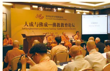
◀各地高僧大德齊集，並於不同分論壇上發表演講，互相交流。