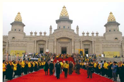
◀靈山梵宮外嘉賓進場的盛況。