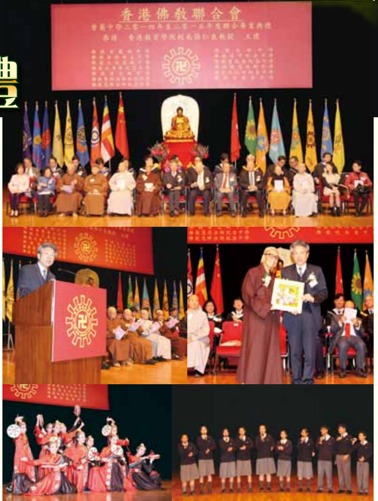
◀眾嘉賓於台上就坐。