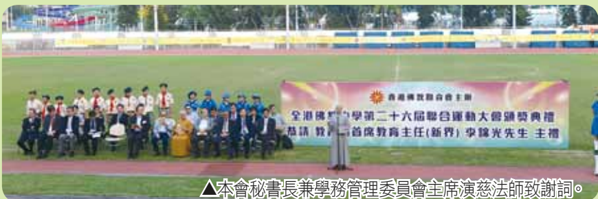
▲本會秘書長兼學務管理委員會主席演慈法師致謝詞。