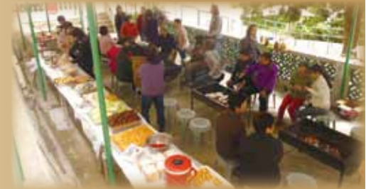
▲參加者享用素食燒烤，分享美食。