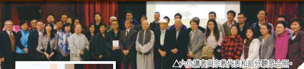
△六位講者與宗教代表和部分聽眾合照。