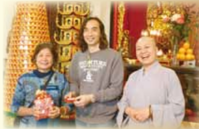
▲修岸法師特意送出多份結緣品和抽獎禮品，給大家帶來多一份喜悅。 ▶大家以虔敬的心抄寫經文。