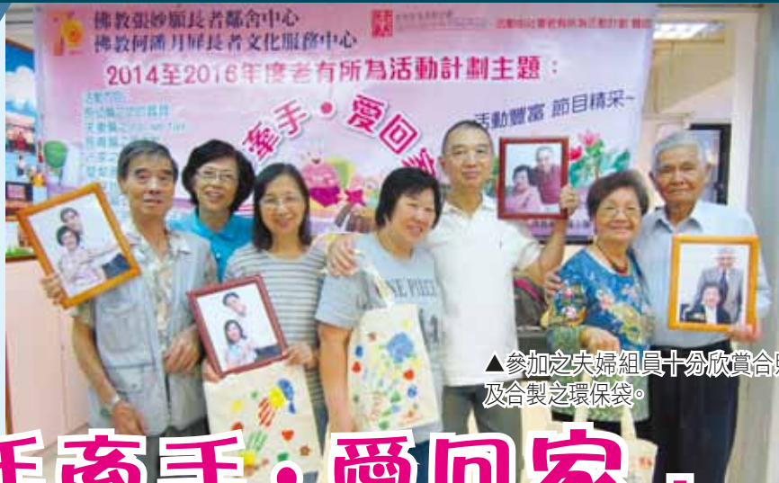
▲參加之夫婦組員十分欣賞合照及合製之環保袋。

俗語說：「家有一老、如有一寶」，在中國傳統家庭之中，長輩能成為連繫家人的重要角色。長者過去人生中，勞碌一生，默默對家人作出支持及貢獻，成為家庭的重要支柱。惟隨著年事漸高，長者往往老來從子，更要適應退休後因角色轉變而帶來的挑戰。因此，佛教張妙願長者鄰舍中心特別舉行一系列活動，協助長者建立健康的 精神生活 ，度過黃金歲月。