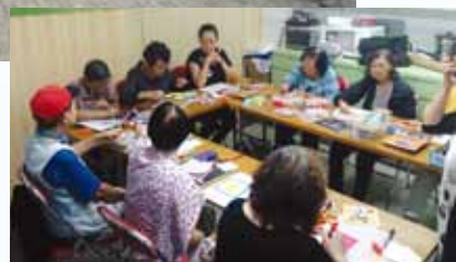
▼ 長幼篇之叻叻寶貝——長者在中心參與陪月班課程。