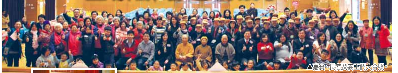
▲嘉賓、長者及義工們大合照。