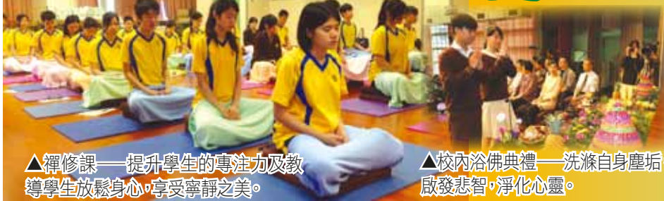
▲禪修課——提升學生的專注力及教導學生放鬆身心，享受寧靜之美。