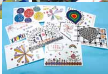
◀ 透過學習禪繞畫創作出來的贈送給鄰舍之心意卡。

活動另一目標是讓長者建立社交網絡，故特別將各長者之作品印製成多款心意卡，透過「鄰里篇之愛傳承」及「情深說話齊齊講」等活動環節，將自己的感激說話利用長者所設計的心意卡，向家人及鄰舍表達關懷及善意。