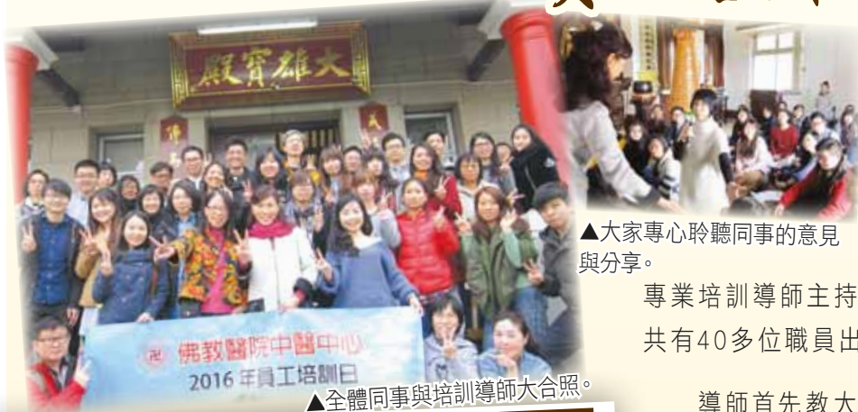
▲大家專心聆聽同事的意見與分享。