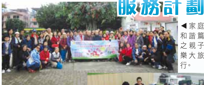
◀ 家庭和諧篇之親子樂大旅行。

2015-2016年度活動主要協助長者面對新挑戰時能作出自我調適及建立社交網絡，最近香港逐漸流行禪繞畫，填色畫冊更是大受歡迎。故此，活動利用禪繞畫為介入手法，作為舒壓活動，在作畫的同時，長者專注繪畫，達致放鬆心情，讓心靈得到恬靜。當中融合了放鬆、平靜、療癒，只需要一枝筆，即使沒有美術基礎的長者，也能夠簡單上手，因繪畫時沒有草稿，沒有刻意規劃，隨心而為。在創作的過程中享受平和的感覺，帶來療癒的效果，有助於減低生活壓力。參加的長者表示，繪畫初期感到無所適從，因沒有臨摹的範本，自行設計感到吃力及黑白色較為單調，但經過一兩次的練習，並加入顏色，漸漸感受到當中的樂趣，及懂得欣賞自己的作品。有長者更表示，最近受家中事情困擾，在繪畫的過程中可訓練個人的專注能力，只集中畫的線條，暫時忘卻一切煩惱。