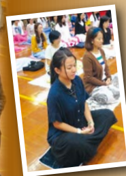
◀教師在工作坊中體驗禪修

隨着政府近年不斷增撥資源投放於學前教育，並於2017至18年度起，實施「免費優質幼稚園教育計劃」，提升幼兒教育質素，邁向優質。佛聯會屬下的幼稚園及幼兒園亦不斷求進，重視教師的專業發展，鼓勵教師持續進修，自我完善。