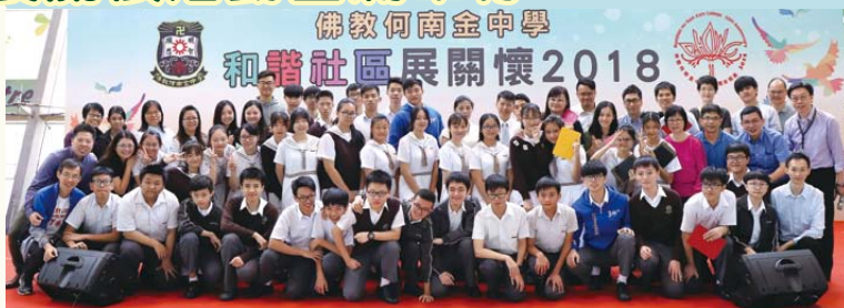
▲攤位活動工作人員

當天來到的人士，除藍田區坊眾之外，尚有不少舊生、家長，場面熱鬧，整項活動在歡樂的氣氛下圓滿舉行。☎