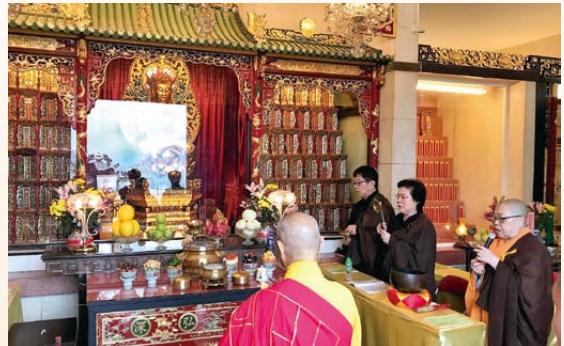
▲香港佛教墳場地藏殿舉行重陽法會

為何重陽法會要念誦《地藏菩薩本願經》？《地藏菩薩本願經》包含地藏菩薩的大悲願和諸佛菩薩的見證，經文以白話文敘述佛陀深入淺出的開示。因為經文強調孝道，而且記載着眾生的生、老、病、死過程，以及如何讓人自行改變命運，還能夠超度冤親債主，令人解脫。