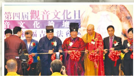
▶三教領袖與主禮嘉賓主持剪綵儀式