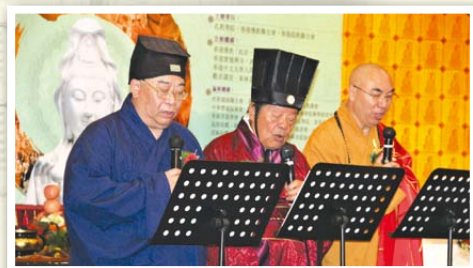
▶儒釋道三教領袖宣讀共同宣言