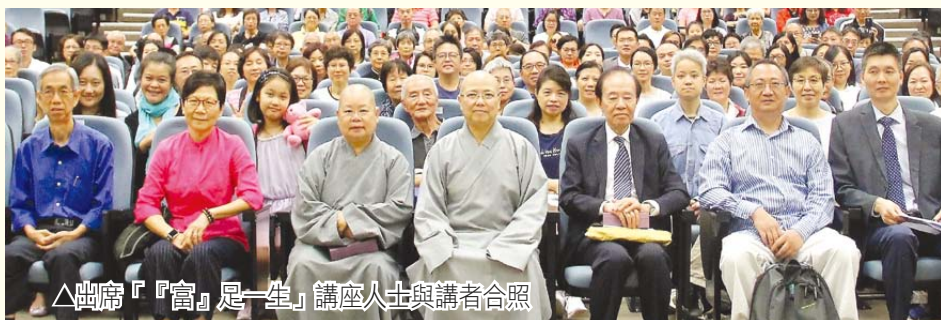
△出席「『富』足一生」講座人士與講者合照

作為信佛的人，可以追求物質財富嗎？演慈法師表示絕對可以，但要以正確的方法求取。從因果來說，布施和廣結善緣，可以增加財富，而且不單只今生富有，還會延至下一世。飛黃騰達之後，要懂得如何利用物質財