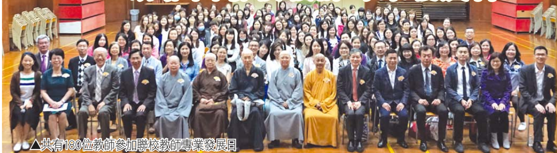
△共有180位教師參加聯校教師專業發展日