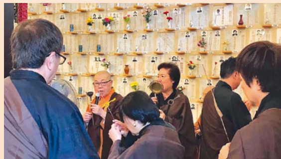
▲法師和居士們誠心誦經