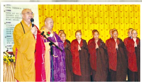
◀本會會長寬運法師致祝福辭