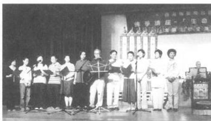
弘法使者在衍空法師講座前獻唱佛曲