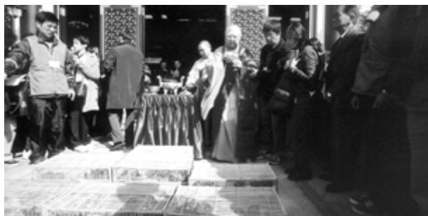
永惺長老主持放生酒淨儀式

12月21日，永惺長老在荃灣西方寺主持慶典，數千嘉賓及信眾雲集同賀，可謂盛況空前。香港佛聯會黎時媛副會長、何德心司庫及秘書處代表出席致賀。