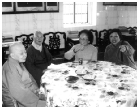
般若精舍性智法師撫今追昔