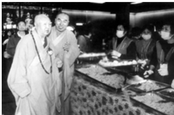
五觀堂內千人自助素宴