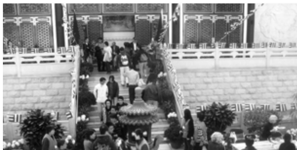
工作人員殷勤接待嘉賓及信眾