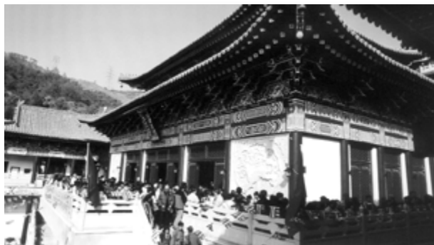
周年慶典盛會一隅信眾如潮