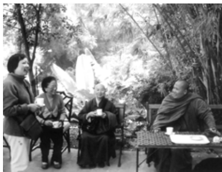
南傳佛教太和寺百加事長老親切接待