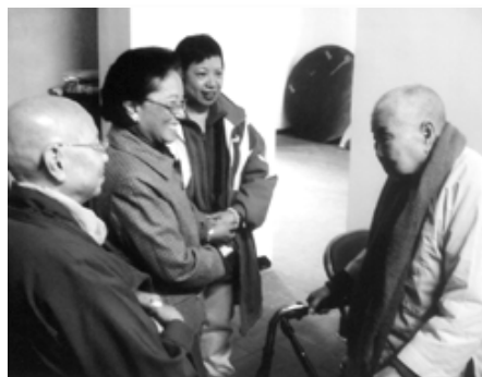
定慧寺老師父喜迎訪客