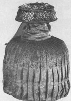
法輪 (清中期 公元十八世紀)

澳門藝術博物館與北京故宮合作，聯同澳門基金會、旅遊局合辦“妙諦心傳——故宮珍藏藏傳佛教文物展”，展出逾百件（套）宗教文物珍品，價值連城，彌足珍貴。