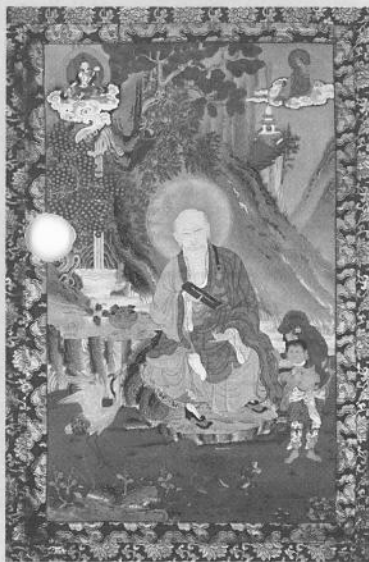
跋陀羅尊者像 (清乾隆 公元1789)

“妙諦心傳——故宮珍藏藏傳佛教文物展” 2003年12月11日至2004年3月12日