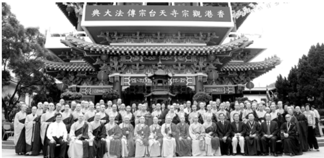
傳法大典全體大合照

農曆八月初六（9月19日）香港觀宗寺舉行了一次盛大的傳法儀典。該寺法主和尚、香港佛教聯合會會長覺光大和尚傳授天台宗第四十七代法脈，予法嗣淨雄法師。儀典還恭請得中國佛教協會常務副會長聖輝長老、中國佛教會理事長淨良長老和香港弘化蓮社住持聖懷長老擔任尊證。