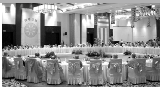
海峽兩岸及港澳七十多位高僧大德主持圓桌會議

海南島三亞市在四月下旬(二十三至二十四日)有兩大佛教界的盛事，其一是兩岸暨港澳佛教圓桌會議的召開，其二是全世界最高的戶外觀音像落成開光。