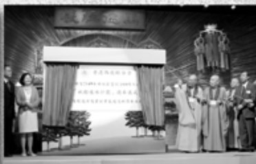
環境保護署副署長趙德麟博士主持「祇樹植林計劃」揭幕儀式