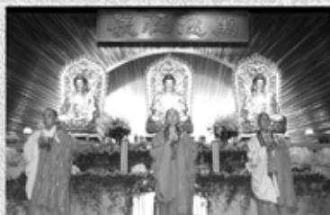
長老手中的蓮花燈照亮了信眾們的心燈

連串節目中，以五月十五日舉行由會長覺光長老主持之佛學講座和五月十六日舉行之傳授三皈五戒菩薩戒法會，是為今次慶祝佛誕暨創會六十周年而特別舉行的其中重點節目。而今屆大會宣傳的主題「弘法利生、萬眾一心」正好配合了上述兩項節目舉辦之目的。此外，香港佛教僧伽學院畢業典禮暨祇樹植林計劃揭幕儀式、誦仁王護國般若經、普佛、傳燈法會等節目共吸引了近二萬人次前來參加。難怪每逢慶祝佛誕大會節目的消息一公開後，善信們便蜂擁而至，希望以第一時間取得門券，因此，佛誕撲「飛」已成為佛教界中常見的現象了。