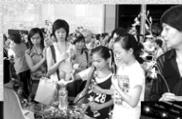
◀ 逾萬善信到場浴佛