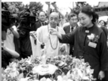
律政司梁愛詩司長恭行浴佛大典