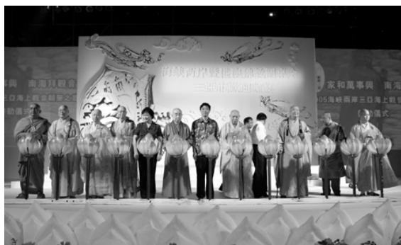
會長覺光長老主持美最蓮花綻放三亞亮燈儀式