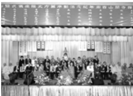
大嶼山區浴佛主禮嘉賓合影