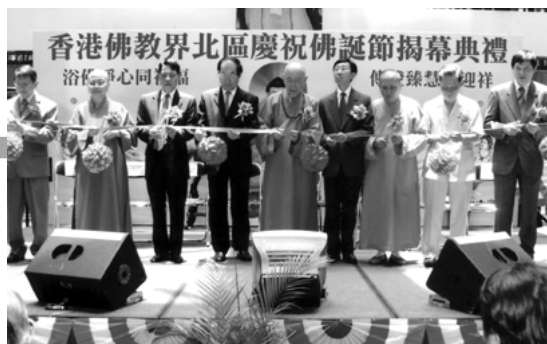
多位嘉賓及官員為新界北區佛誕節活動剪綵

在每年的佛誕節期間，各佛教寺院、道場分別均有舉行慶祝活動，本會為擴大慶祝範圍，更於港、九、新界各區以至離島舉辦大型慶祝活動，地點除佛教道場外，更推展至各區大型商場，讓市民坊眾齊來參予慶祝，認識佛誕節意義，亦一起感受到佛誕節的喜悅。