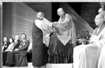
香港佛教僧伽學院院長覺光長老頒授畢業證書予學僧