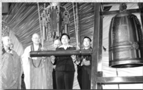
主禮嘉賓主持佛誕開幕鳴鐘儀式