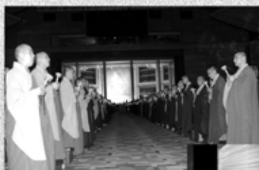
▲五千多人參加傳燈法會