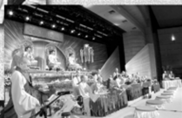
▲眾長老主持傳授三皈、五戒、菩薩戒法會