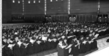
▲逾千名善信與學生皈依及受戒