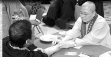
▲法師替求戒戒子燃香