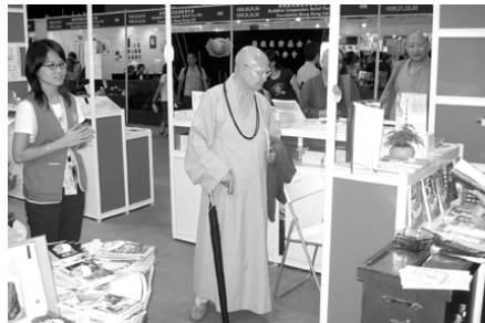
融靈長老參觀佛教坊