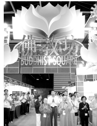
法師帶領主持佛教坊灑淨儀式