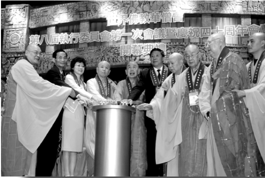
嘉賓主持開幕按鈕儀式