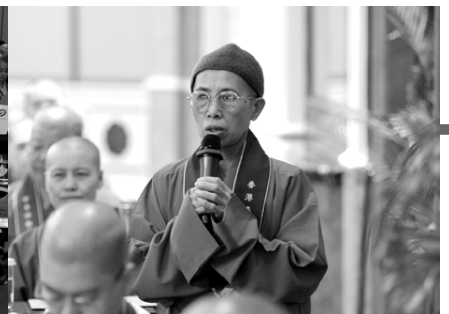
台下委員踴躍發言