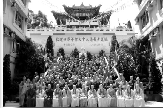
大合照於香港觀宗寺

國際性佛教組織世界佛教華僧會於九月十五及十六日一連兩天在香港召開會議。主禮嘉賓包括：國家宗教局葉小文局長、中國佛教協會會長一誠長老、常務副會長聖輝長老專程由北京抵港，聯同中聯辦副主任黎桂康先生、民政事務總署署長陳甘美華太平紳士主持開幕儀式。