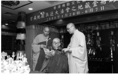
佛聯會會長覺光長老加持壇場證盟功德

香港佛教文化協會，舉行首屆地藏無遮大法會，專修地藏法門，一心持誦地藏菩薩聖號、地藏菩薩