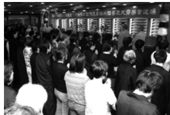
國內外善信四百餘人參與大典

願我們的世界和諧安定，永遠沒有戰爭暴亂； 願我們的國家風調雨順，永遠沒有天災人禍； 願我們的社會人心安定，永遠沒有怨恨紛爭； 願我們的生活豐衣足食，永遠沒有經濟風暴； 願我們的身心健康無憂，永遠沒有煩惱困擾。