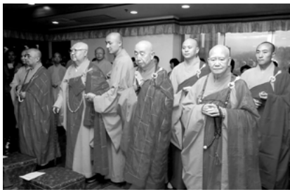
諸山長老主持大典