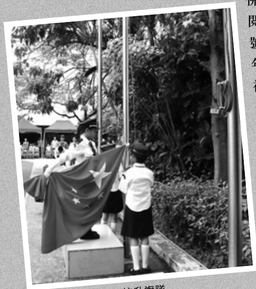
佛教榮茵學校上午校升旗隊

佛教榮茵學校上午校主辦「2006公民教育日」慶祝回歸升旗禮暨檢閱儀式在香港回歸紀念日節前夕30-6-2006於新界元朗鳳攸南街六號佛教榮茵學校球場舉行。早上十時進行升旗典禮，由學校升旗隊年僅十歲的學生擔任升旗手，負責升旗儀式。當日活動包括升旗禮、檢閱儀式、小學生交通安全隊步操表演及幼稚園學生交通安全隊花式步操表演。還有元朗區幼稚園學生繪畫及填色比賽、小學生「給祖國的情書」寫作比賽及中學生「中國最新發展」簡報設計比賽頒獎典禮。