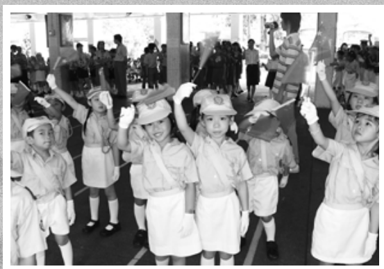
同學們揮舞國旗慶賀香港回歸