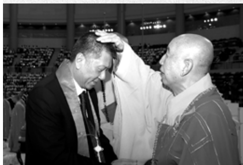
覺光長老為澳門特區行政長官何厚鏞先生祝福

澳門為慶祝回歸祖國七週年，由民政總署主辦，“重走唐僧西行路”組委會及澳門佛教總會承辦，為有史以來規模最大，規格最高的“慶祝澳門回歸祖國七週年 — 福蓮澳門祈福法會”，於06年12月20日上午在東亞運體育館隆重舉行。