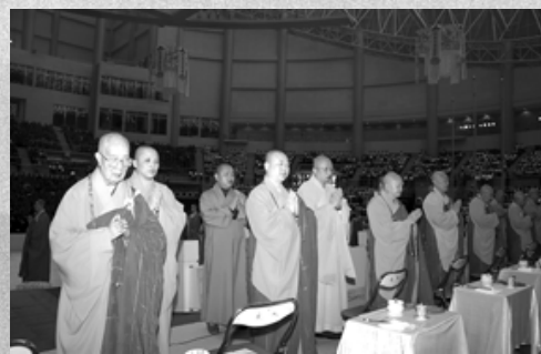
諸山長老為法會主持祈福

上午九點，主持祈福大典包括香港佛教聯合會會長覺光長老、中國佛教會理事長淨良長老、中國佛教協會副會長覺醒法師、澳門佛教總會會長泉慧長老、香港觀音寺住持融靈長老、香港寶蓮禪寺住持智慧長老和退居方丈初慧長老、香港佛教聯合會宗教事務監督覺真長老、澳門佛教總會副會長願炯法師、澳門佛教總會理事長健釗長老與及台北、黑龍江、南京、廣州市等地大德長老、法師共十九位一同進場。