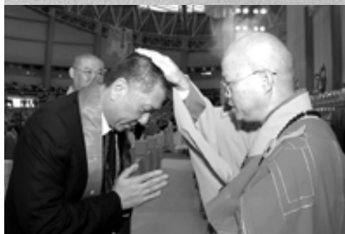
健釗長老為澳門特區行政長官何厚鏞先生祝福

在“寶鼎讚”的梵唄聲中，主法和尚手持楊枝淨瓶灑淨、毛巾、珠砂筆、寶鏡，為佛壇放置一零八尊象牙瓷製“荷花祥雲觀音”及“和諧第一枝蓮花如意”開光。接著曹溪佛學院七十二位僧人以二龍出水式繞佛灑淨及迴向後，大會恭請特首何厚鏞先生、香港佛教聯合會覺光長老及“重走唐僧西行路”之明賢、明慧兩位法師分別致詞祝賀。