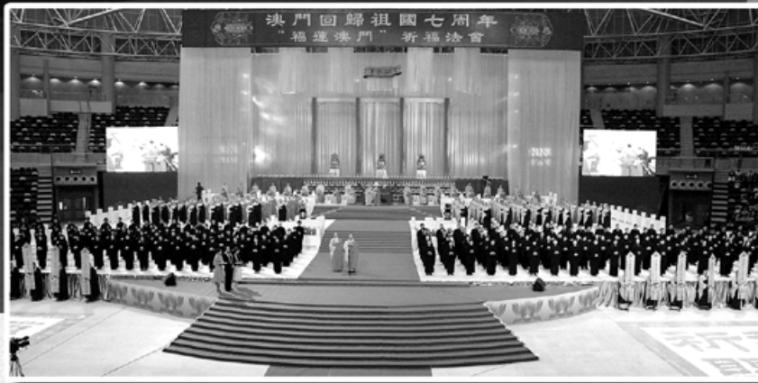
法會壇場莊嚴殊勝