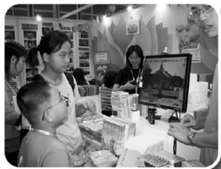
小朋友參與我們的電腦佛學問答遊戲。