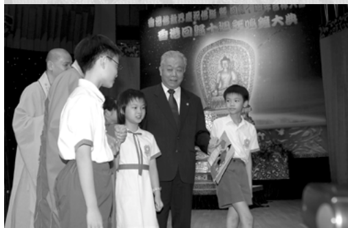
學生代表向領導人獻送吉祥燈

在鳴鐘典禮上，大會主席覺光長老、前民政事務局長何志平局長、衛生及福利食物局周一嶽局長、房屋及規劃地政局孫明揚局長及國家宗教事務局葉小文局長首先主持亮燈儀式。接著為民政事務專員、各區區議會主