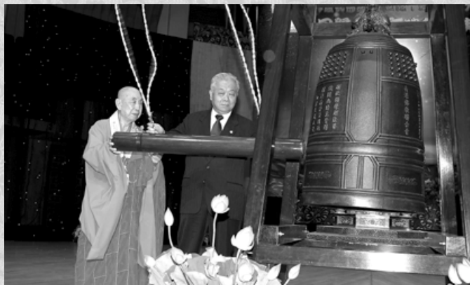
國家領導人全國人大副委員長兼秘書長盛華仁先生鳴吉祥鐘