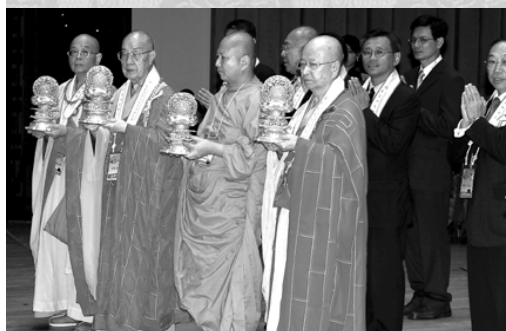
海內外長老帶領各區民政事務專員及區議會主席供吉祥燈

二零零七年六月三十日晚上十時三十分跨越七月一日凌晨，正式標誌著香港回歸祖國十週年之歷史時刻，香港佛教界在尖沙咀香港文化中心音樂廳舉行了「祝香港回歸十週年鳴鐘大典」，受到海內外教界人士高度注目。國家領導人全國人大副委員長兼秘書長盛華仁、中央駐港聯絡辦公室主任高祀仁、國務院港澳辦公室常務副主任陳佐洱、統戰部副部長朱維群、立法會主席范徐麗泰、前民政事務局長何志平、社團首長和香港各界人士等應邀出席。