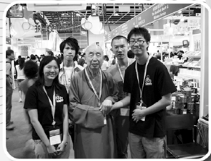
覺光長老與本會弘法使者合影。