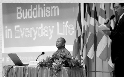
數百信眾參聽佛教與生活講座

在約二小時的開示中，校長主要是向大眾講解佛法是否有需要於生活上，以及如何把它應用於生活上。他認為佛法是一套圓滿而取道入世的生活哲學，得聞法益便能觀照及省察自己，在這個人內心混亂而又浮躁的社會，作為都市人如何可以應用佛法於生活中呢？校長提出只要緊記專注眼前當下，確定目標，摒棄雜念，本著回饋社會的心，便不難在無盡涯的苦海裡找回一盞明燈。起伏不定的情緒是對人的心靈帶來兩個層次的傷害，校長以兩枝箭比喻，第一支箭讓身體飽受痛楚，第二支箭則是我們給自己的心繼續受到苦楚。那麼，要安頓紊亂煩擾的情緒，首先需要專注正念，調服身心，念誦佛經，讓佛法加持，可以將已蒙塵垢積聚的心靈重新打開，並達致身心靈的健康和諧。