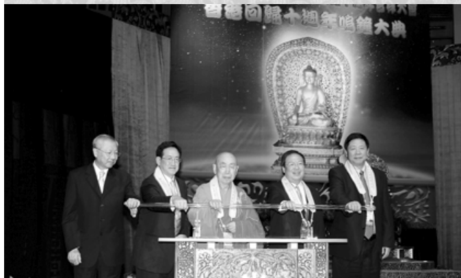
孫明揚局長、周一嶽局長、覺光長老、何志平先生、葉小文局長主持亮燈儀式