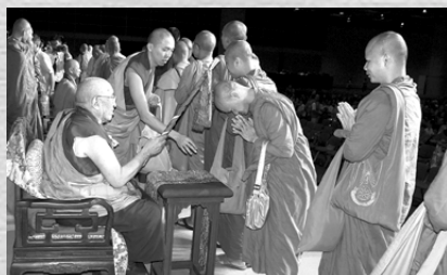
創古寧波車為大眾加持