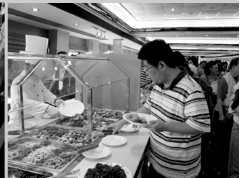
享用豐富素自助餐