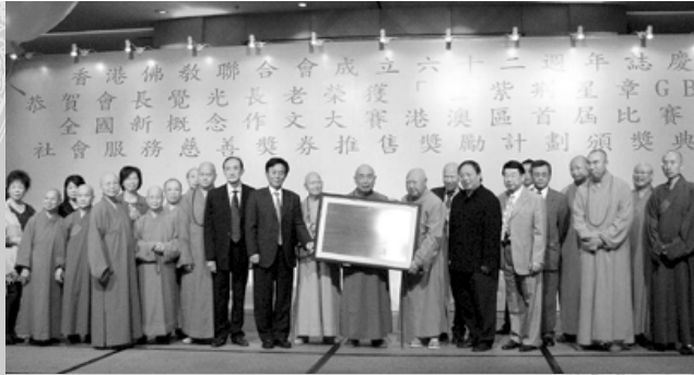
各道場代表與 本會四眾同仁向覺光長老 致送賀匾