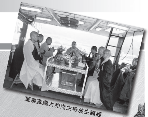
董事寬運大和尚主持放生誦經