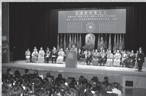
莊嚴而隆重之場面

香港佛教聯合會會屬中學2007至2008年度聯合畢業典禮已於二零零八年十二月四圓滿結束。當天，本會很榮幸邀請了香港大學專業進份學院院長李焯芬教授擔任主禮嘉賓。李焯芬教授曾任香港大學副校長，現任香港大學專業進修學院院長，多年以來在教育界貢獻良多，他與畢業同學分享多年來的學習經驗，李教授又引用佛陀之教誨，勸勉同學要積極解決人生路上遇到的各種難題，有個更快樂自在的人生，為社會大眾盡心服務。其後，李教授為畢業典禮主持授憑儀式，向各畢業同學頒授證書，實令典禮增光不少。