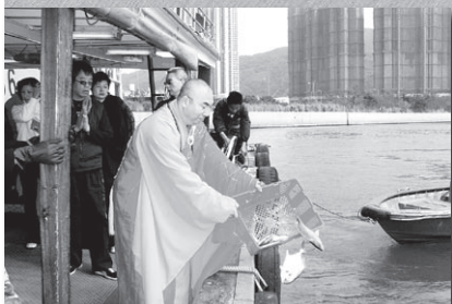
寬運大和尚親手將魚放到海裡