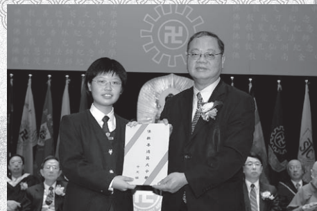
主禮人頒授畢業證書