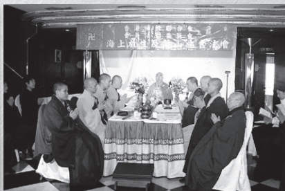
寬運大和尚領導主持蒙山施食法會