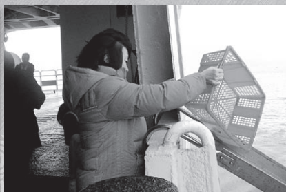
參加善信每人均可親手將海產放生