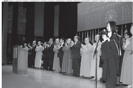
主體嘉賓一同合十唱佛寶歌

最後，全體嘉賓、校長、老師及學生一起唱詠校歌，並同誦佛號，畢業典禮在一片柔揚歌聲中圓滿結束。