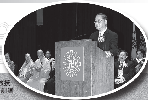
主禮人李焯芬教授 向全體畢業生致訓詞