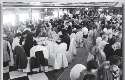
三百多名會友開開心心參加是日活動