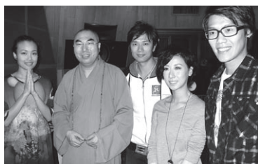
董事寬運大和尚探班

蓮花開處 皇天出世 (佛祖出世) 人間發願渡眾生 功德不見底 梵音飄處 佛光生輝 慈悲化盡俗世火 苦海得舟濟 未懼掛礙未了空 自在覺悟能度世 何愁紅塵是鏡花 釋迦釋出真諦 合什放下滅眾苦 滴滴法露能淨世 原來佛緣在寸心 不驚不恐不畏