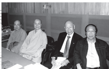
黎時媛副會長和眾位董事探班