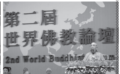
會長覺光長老在閉幕典禮上發言