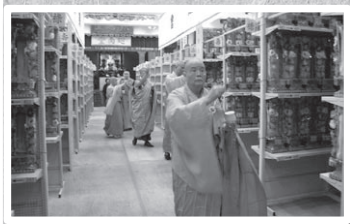
眾位長老和法師灑淨壇場

香港佛教聯合會於四月三日至九日，在香港銅鑼灣東院道十一號香港佛教聯合會文化中心舉行一年一度之「清明思親法會」，除了為本會開辦的各項慈善事業籌集善款外，另一更重要的目的是宣揚國人思親報恩和慎終追遠的良好美德。每逢清明時節，銅鑼灣東院道一帶，處處可見一家人扶老攜幼，帶著鮮花生果出席法會，場面熱鬧而感人。