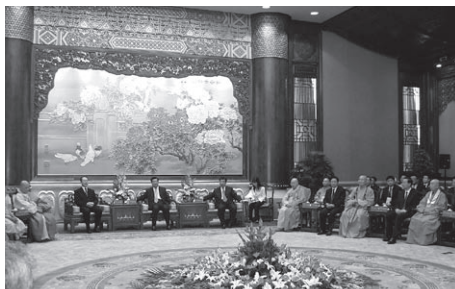
國家領導人接見眾位地區宗教領袖