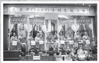
四大部洲餽口佛事