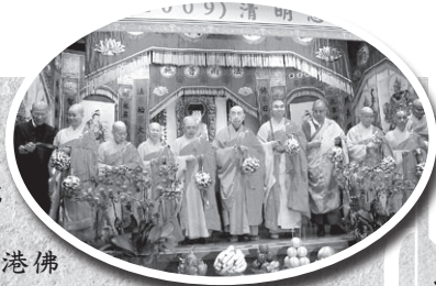
己丑年清明法會開幕剪綵儀式

香港佛教聯合會於四月三日至九日，在香港銅鑼灣東院道十一號香港佛教聯合會文化中心舉行一年一度之「清明思親法會」，除了為本會開辦的各項慈善事業籌集善款外，另一更重要的目的是宣揚國人思親報恩和慎終追遠的良好美德。每逢清明時節，銅鑼灣東院道一帶，處處可見一家人扶老攜幼，帶著鮮花生果出席法會，場面熱鬧而感人。