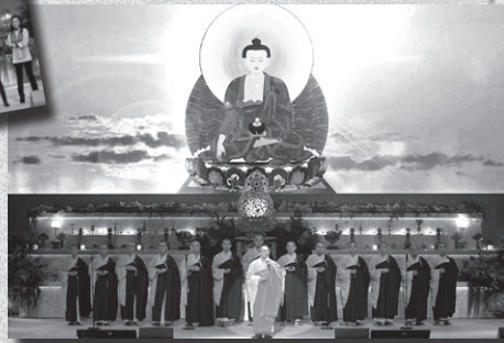
上海玉佛寺梵樂團精彩演出