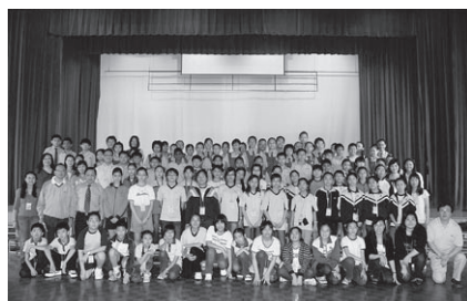
參觀新加坡立偉小學