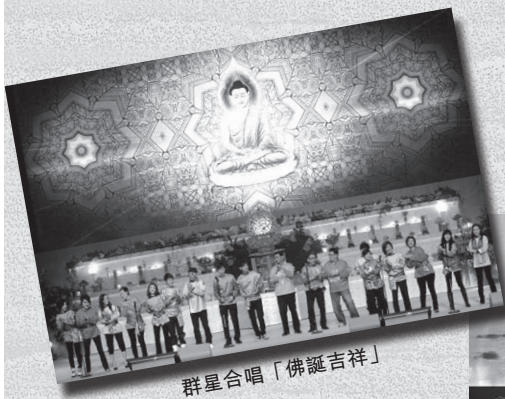
群星合唱「佛誕吉祥」