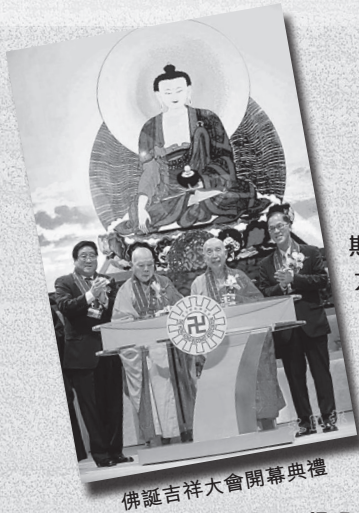
佛誕吉祥大會開幕典禮

今年農曆四月初八佛誕節亦適逢是香港實施佛誕公眾假期十週年的日子，本會於紅磡香港體育館，由四月初七至初九一連三天舉行盛大慶祝活動。剛好三天的公眾假期，正好為全港佛弟子和廣大市民提供了假日的好去處。