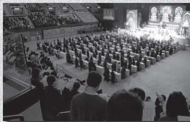
莊嚴殊勝之華嚴懺行願法會