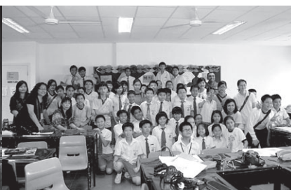
參觀新加坡德賢小學，本會同學獲與該校學生一起上課