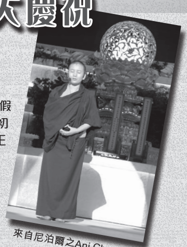
來自尼泊爾之Ani Choying 獻唱佛曲

首天（四月初七）的節目包括般若吉祥誦經法會與佛誕吉祥文藝匯演晚會為大會揭開了序幕。當晚的匯演以佛教梵唄為主幹，更特別的是本會邀請得顧家輝先生和林夕先生作了一首《佛誕吉祥》歌，以紀念香港實施佛誕公眾假期十週年。這首歌得到了五十多位歌星義務灌錄，希望年年佛誕，萬家頌唱。此外，上海玉佛寺梵樂團、來自尼泊爾的Ani Choying、國際知名歌手薩頂頂小姐應邀專程來港演出。而本會會屬幼稚園天真可愛的數十位小朋友傾力表演均贏得全場觀眾熱烈的掌聲。