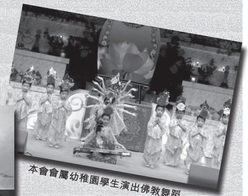
本會會屬幼稚園學生演出佛教舞蹈