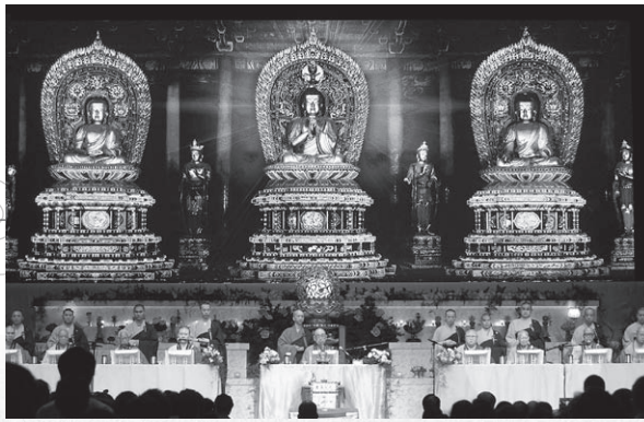
九位導師主持皈依大典