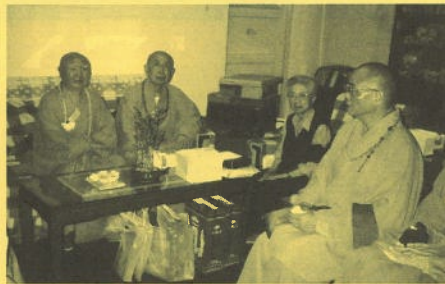
香港佛教界弔唁團到佛協會長趙樸初居士府上慰問趙夫人