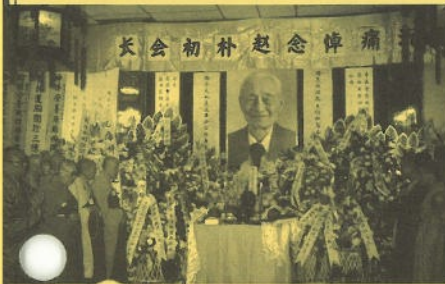
國內外大德高僧齊集誦經

香港佛教聯合會更將於6月18日上午10時正假香港銅鑼灣東院道十一號佛教文化中心禮堂舉行追思讚頌法會，歡迎各界善信參加。