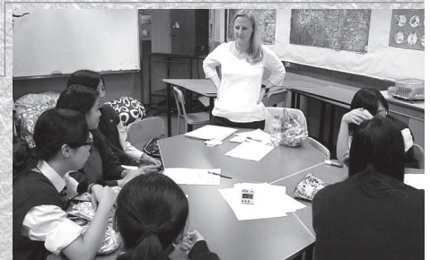
外籍教師授英文課