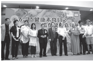
本會董事與眾嘉賓合照