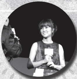
活動大使謝安琪小姐為參與活動的青少年朋友打氣及唱歌

香港佛教聯合會青少年中心應2009年灣仔區青少年暑期活動統籌委員會與灣仔民政事務處的邀請，於7月11日星期六晚上，在灣仔伊利沙伯體育館合辦一項名為「全民迎東亞：共創傳奇音運會」大型活動，當日節目並得到新城知訊台全力支持，內容包括：歌星及團體表演、問答比賽及競技遊戲等。中心派出一隊由三位義工組成的參賽隊伍，參與音運會內的問答及競技活動；另外亦組織了一隊主要由佛教黃鳳翎中學義工隊組成的啦啦隊，為參賽的隊員落力打氣。最後，中心隊伍於比賽更奪得亞軍的佳績。當晚參與的青少年十分投入，團隊氣氛濃厚，為進入本年度的暑期活動揭開序幕。