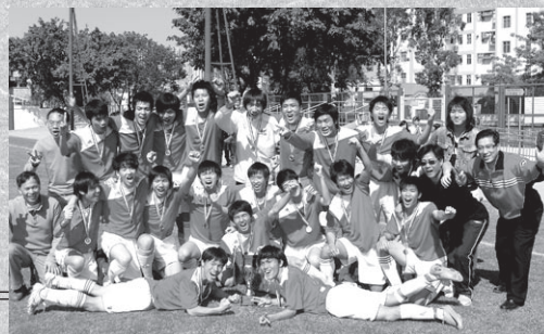
學校足球隊戰績輝煌