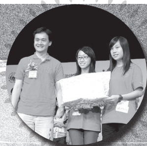
嘩!佛青隊代表叻叻，勇奪音運會問答比賽亞軍佳績。