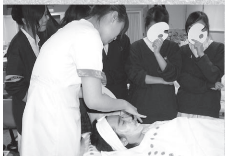
開辦應用學習及特色課程