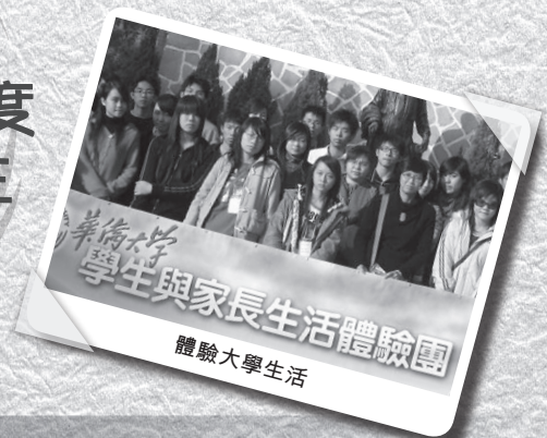
華僑大學 學生與家長生活體驗團 體驗大學生活

多元化的課程 跨越學習障礙 發揮學生潛能 學校配套周全 保送升讀大學 配合社會發展