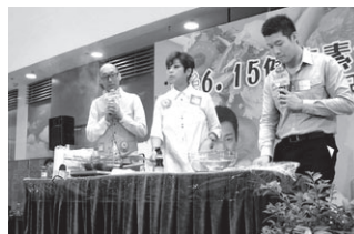
肥媽即場示範健康素食