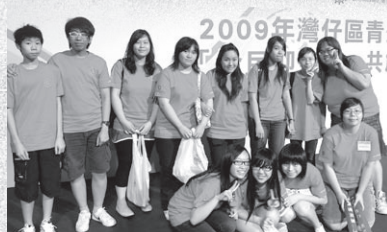
佛教黃鳳翎中學啦啦隊

香港佛教聯合會青少年中心應2009年灣仔區青少年暑期活動統籌委員會與灣仔民政事務處的邀請，於7月11日星期六晚上，在灣仔伊利沙伯體育館合辦一項名為「全民迎東亞：共創傳奇音運會」大型活動，當日節目並得到新城知訊台全力支持，內容包括：歌星及團體表演、問答比賽及競技遊戲等。中心派出一隊由三位義工組成的參賽隊伍，參與音運會內的問答及競技活動；另外亦組織了一隊主要由佛教黃鳳翎中學義工隊組成的啦啦隊，為參賽的隊員落力打氣。最後，中心隊伍於比賽更奪得亞軍的佳績。當晚參與的青少年十分投入，團隊氣氛濃厚，為進入本年度的暑期活動揭開序幕。