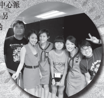
歌星鄭融與佛青義工隊員合照留念