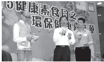
林超英講述地球溫度轉變對人類的影響