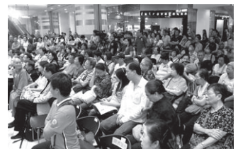
現場觀眾座無虛席