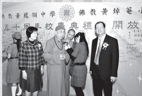
會長覺光長老親蒞主持黃鳳翎中學及黃焯菴小學50周年校慶