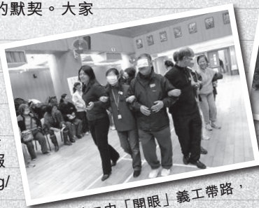
蒙眼義工由「開眼」義工帶路，必須互相信任。

本會現正接受新義工登記，如有興趣者，可到本會網頁下載「義工登記表」。寄交填妥之表格及一張相片後，本會將在招募義工服務時，再行聯絡。 http://www.hkbuddhist.org/download/volunteer.doc