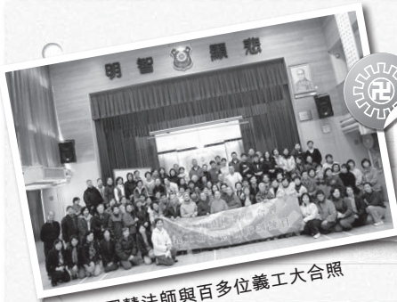
圓慧法師與百多位義工大合照