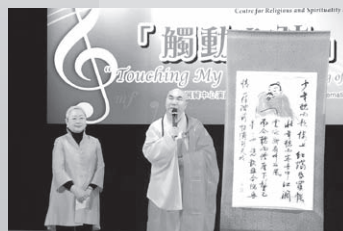
寬運大和尚與各表演團體代表分享 佛教音樂對心靈的重要性