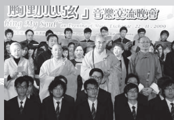
全體表演者在圓滿前大合照