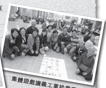
集體遊戲讓義工重拾童真