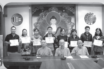
結業同學與三位導師合照

課程共十講，由10月開始至11月15日結束，除8堂的基礎佛學外；還有一天的『寺院巡禮』活動。學員及其親友有機會親自到香港名剎大嶼山觀音寺與寶蓮禪寺遊覽和參學；參加者可以親近到兩間寺