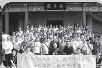
眾學員與融靈長老合照