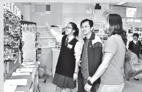
學生積極參與校慶，並為嘉賓介紹學校