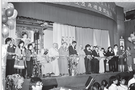
典禮隆重舉行，十多位本會董事為典禮剪綵