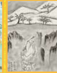
步鐘 雪山觀音意境金獎