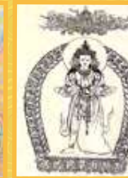
朱妙善 古韻新風觀音金獎