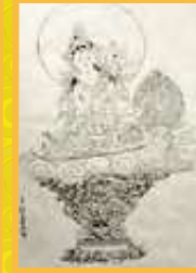
朱妙善 法輪白度母觀音金獎