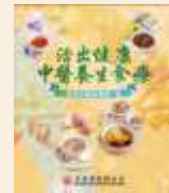
《活出健康——中醫養生食療》