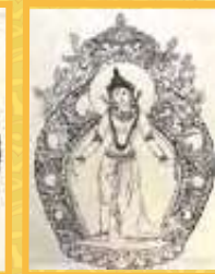
朱妙善 古韻新風觀音金獎